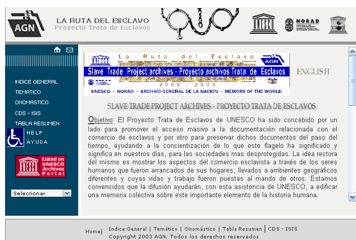
Figura 1: Catálogo La Ruta del Esclavo , incluido en la sede web del AGN de Argentina.

Además, en la sede web se incluye un catálogo, denominado La Ruta del Esclavo (figura 1). Su tema central es la esclavitud, pero recoge documentos que son muy interesantes para el estudio de la historia naval. Este catálogo tiene tres secciones: catálogo temático, onomástico y tabla resumen, pero tan sólo en la tercera se incluyen digitalizaciones 8 .