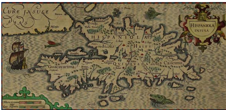
Figura 9: Mapa de La Española, al parecer del siglo XVII, semejante a los existentes en el Atlas de Jodocus Hondius y Gerardo Mercator.