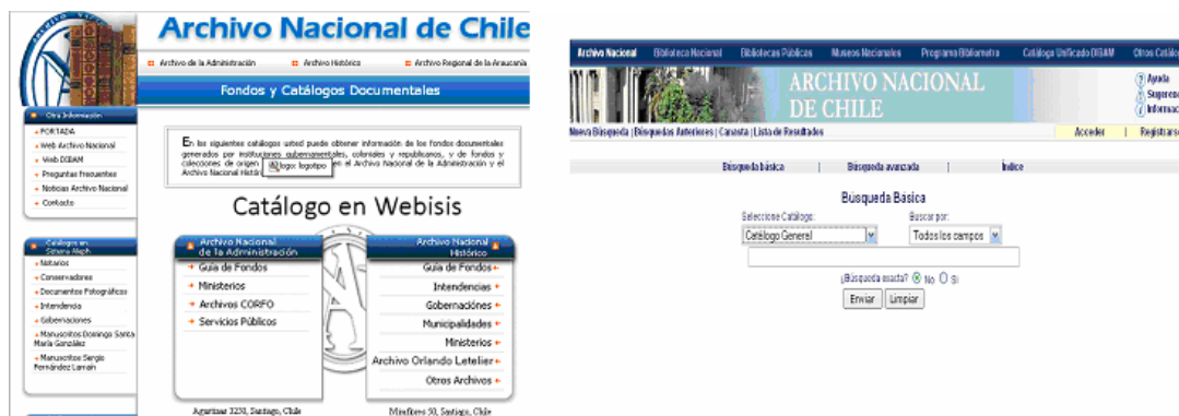
Figura 2: Catálogo automatizado (izquierda) y catálogo unificado (derecha) incluidos en la sede web del AN de Chile.

En el catálogo unificado del AN de Chile (figura 2) también se encuentra bastante información sobre el mundo marítimo, que no especificamos aquí porque nos extenderíamos demasiado.