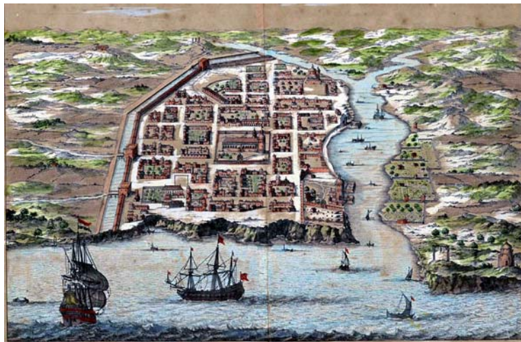
Figura 6: Vista de la ciudad de Santo Domingo en el siglo XVII.