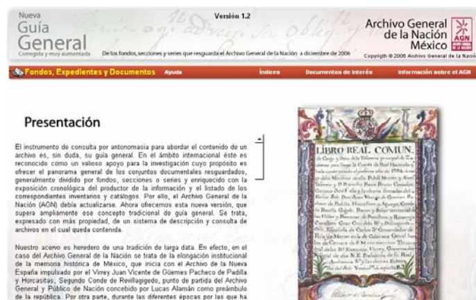
Figura 4: Guía General, incluida en la sede web del Archivo General de la Nación de México.

En el sitio web del AGN de México 23 se incluyen diversas herramientas de descripción y consulta (cuadro de clasificación, guía, inventario), siendo la más completa la Guía General (figura 4). Esta Guía es fruto de la reclasificación de los grupos documentales de la Guía publicada en 1990, por eso se llama “Nueva Guía General”. Ofrece una completa presentación de la guía, información sobre el archivo, estadísticas del acervo, y contiene varios tipos de índices. Combina dos tipos de búsqueda: búsqueda libre o search (el usuario introduce el término de búsqueda deseado) y búsqueda mediante desplegables o browsing (el usuario va descendiendo por el nivel de descripción seleccionado).