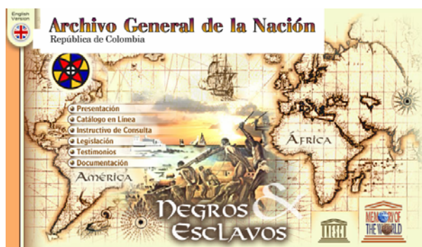
Figura 3: Catálogo Negros Esclavos , incluido en la sede web del AGN de Colombia.

No podemos conocer si el AGN de Colombia conserva documentos relacionados con la Marina, ya que en su sitio web 16 no funciona el enlace a la descripción de los fondos. Sin embargo, hay que destacar el fantástico y completo catálogo en línea que incluye, denominado Negros Esclavos (figura 3), en el cual, a pesar de que trata sobre la esclavitud, podemos obtener información relacionada con el mundo marítimo, como la referida a puertos en los que se realiza el comercio de esclavos. No detallamos cuales son porque nos extenderíamos demasiado.