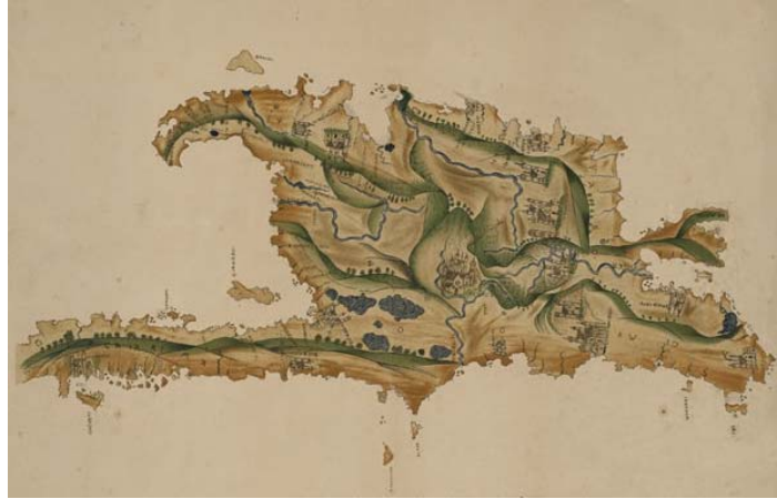
Figura 5: Mapa de la Isla de Santo Domingo confeccionado alrededor de 1516, conocido como Mapa de Bolonia por encontrarse su original conservado en la Biblioteca de la Univ. de Bolonia.