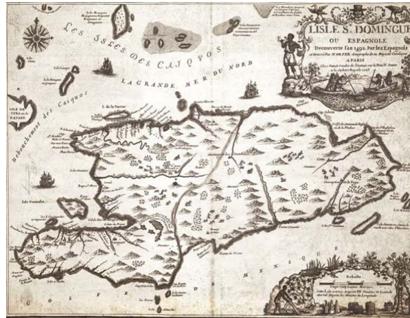
Figura 8: Mapa de la Isla de Santo Domingo o La Española, de 1723, por Nicolas de Fer. [126]