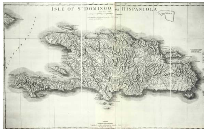
Figura 7: Mapa de Santo Domingo o La Española de 1776, por Joseph Solano.