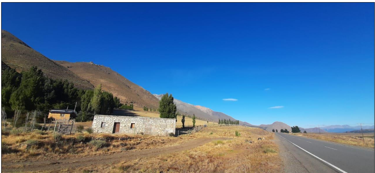
Fig. 5: La casa de piedra en la que funcionaba el boliche de los Assin, en febrero de 2021. A su lado, la actual Ruta Nacional N° 40, que en ese tramo corre sobre el antiguo camino entre Nahuelpan y Esquel Fuente: fotografía de Silvia González.