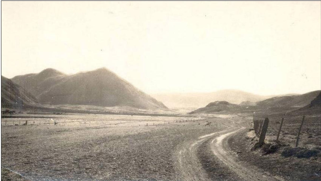
Fig. 3: Ingreso a Esquel desde Nahuelpan, circa 1920.