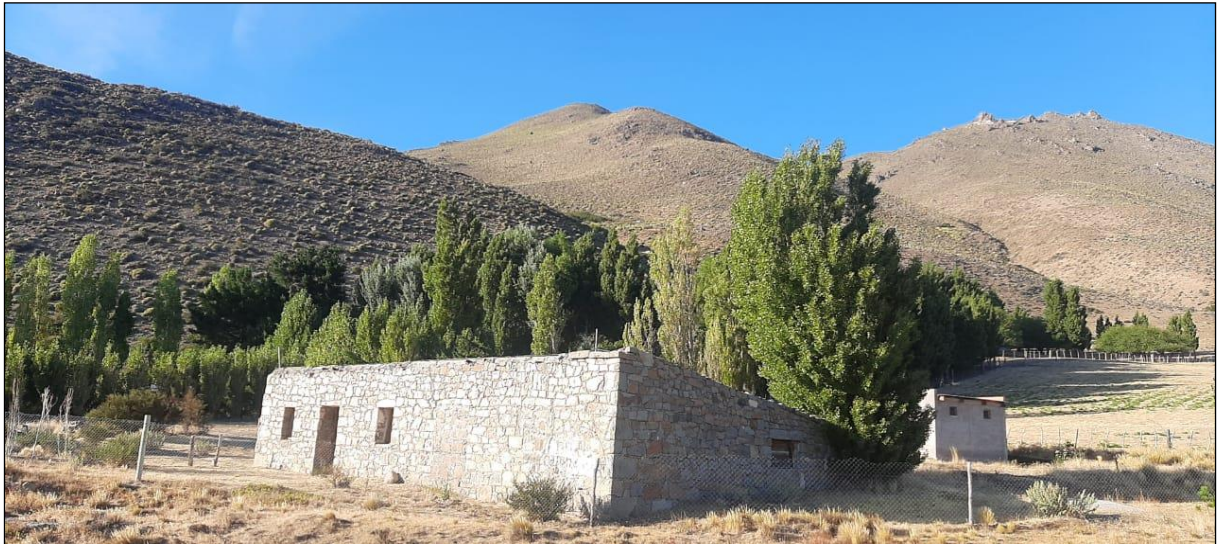
Fig. 4: La casa de piedra en la que funcionaba el boliche de los Assin, en febrero de 2021.

antecedentes hasta el desalojo de los pobladores de Nahuelpan en 1937.