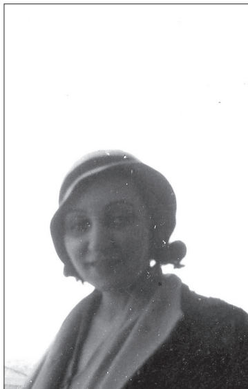
Norah Borges en su casa de la Calle Velázquez. (Madrid). Febrero 1933 (PCCAO).