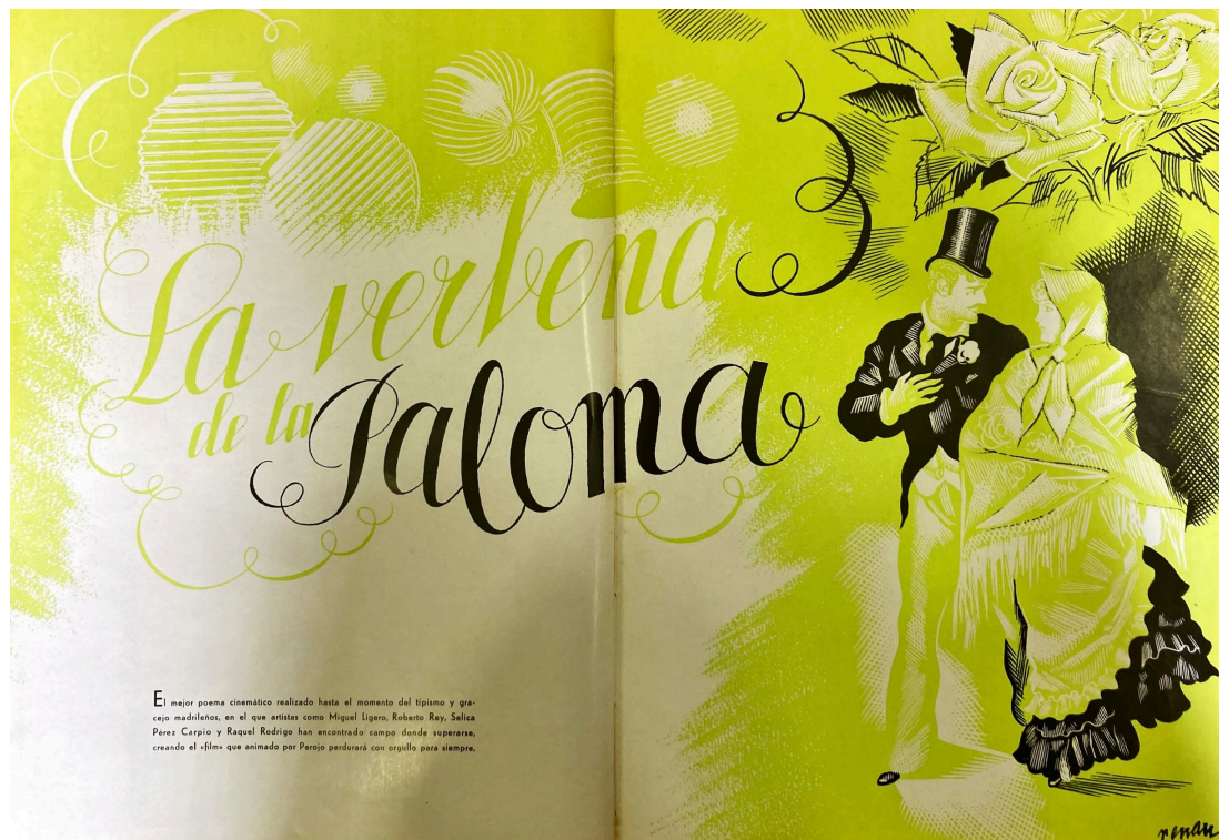
Figura 1. Diseño de La verbena de la paloma firmado por Josep Renau, publicado en el Anuario de CIFESA de la temporada 1935-1936.

En cualquier caso, lo cierto es que, por mucho que Renau renegara de esta vertiente, su mayor contribución a la industria-arte cinematográfico (elementos difícilmente divisibles dentro de este enfoque) fue en el cartelismo. Y es que, como veremos en más pintores, el sustento económico durante el exilio venía más por adaptarse a los cánones comerciales que a