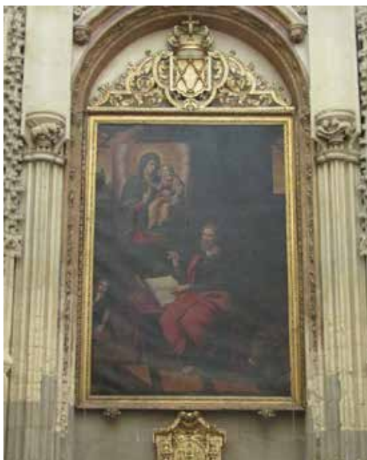
FIGURA 4. Francisco García. San Lucas Retratando a La Virgen y El Niño. C. 1607. Catedral de Murcia.

Carmona y Cabello Velasco, 1990-1991: 133-142; Belda Navarro y Hernández Albaladejo, 2006: 223-227).