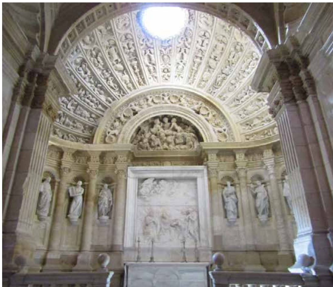
FIGURA 1. Detalle de la Capilla de los Junterones. S. XVI. Catedral de Murcia.

Rejón de Silva lo valoró como un espacio destacable; las características de la obra iniciada por Jacobo Florentino y finalizadas por Jerónimo Quijano responden a unos valores arquitectónicos meritorios y dignos de ser reseñados entre las obras más significativas del conjunto catedralicio (Gutiérrez-Cortines Corral, 1987: 174-185; Nieto Alcaide, Morales y Checa Cremades, 1997: 144-145). En concreto, alabó de manera general la estatuaria y relieves que conforman este espacio: el conjunto de santos y de sibilas donde se entremezclan lo religioso y profano, el frontal de altar mármoleo y los demás ornamentos donde se atisba una clara influencia de las corrientes artísticas italianas (Belda Navarro y Hernández Albaladejo, 2006: 180-181). Por lo que respecta a la estatuaria, junto al conjunto descrito es nombrada la imagen de una Virgen de mármol que debía hallarse en el claustro; quizá esta imagen podría corresponder a la que hoy en día se encuentra en el Museo de la Catedral. La escultura encaja dentro de los criterios estéticos que pretende subrayar Rejón de Silva y en la cronología en la que se realizan las descripciones 11 .