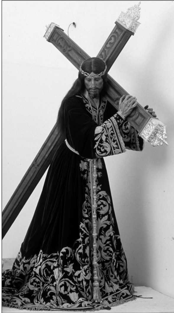
Fig. 1. Francisco Salzillo, Jesús Nazareno , Huércal-Overa (Almería), Iglesia Parroquial de Nuestra Señora de la Asunción.

se ynterrumpía muchas veces y se suspendía los de disciplina. Tercero: por el ser preciso exponer el Sacramento por la mañana quando alguno de los hermanos se halla ya oleado para hacer la recomendación de su Alma, y demás ejercicios de oraciones bocaleas, que practica la Santa Escuela en semejantes casos, todos los que se suspendían o por razón de misas cantadas o de ofizios funerales, y para evitar todo los expresados ynconvenientes dispuso la execución de dicha Capilla en la que como separada de dicha Yglesia se podrán practicar sin los expresados inconbenientes...»