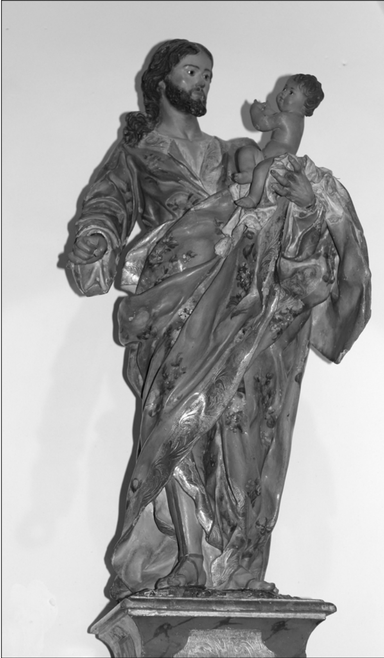
Fig. 6 Francisco Salzillo (taller de), San José y el Niño , Urrácal (Almería), Iglesia Parroquial de Santa María.