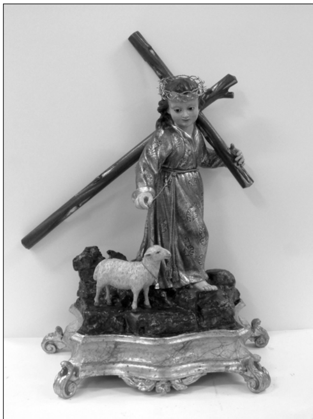
Fig. 13. Anónimo, Niño Jesús de Pasión , Almería, Iglesia Parroquial de Santiago Apóstol.

El catálogo de obras de Roque López en Almería también se enriquece con un Niño Jesús de Pasión , fechado en 1787, descrito por su autor de «...tres palmos menos cuatro dedos y peana de diez dedos... con cruz en una mano y en la otra una cestita con clavos, martillo...» que debió ser el que se veneraba en el altar de los Dolores de Nuestra Señora de la iglesia del convento de los dominicos, y con un San Miguel «...de dos palmos con dragón...» realizado en 1805 para esta misma comunidad, ambos desaparecidos.