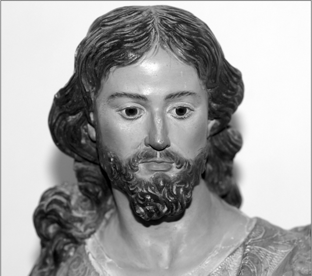
Fig. 7. Francisco Salzillo (taller de), San José y el Niño (detalle), Urrácal (Almería), Iglesia Parroquial de Santa María.

del año 1608, en tiempos del prelado franciscano don fray Juan de Portocarrero (1603-1631), quién obtuvo del monasterio oscense de San Juan de la Peña la cesión, en 1620, de unas reliquias del citado santo para su veneración en la catedral de Almería 30 . Sin embargo, no sería hasta 1742 cuando se determinó adjudicar dentro del templo un espacio privativo que sirviese para alojar tan sagradas reliquias, eligiéndose para ello la capilla que hasta entonces había servido al culto con el título del Salvador , ubicada en el extremo meridional de la girola de la iglesia