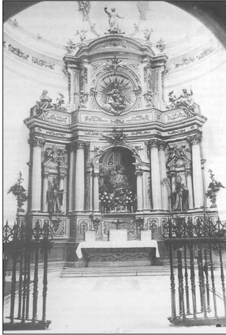
Fig. 8. Francisco de Testa, Retablo de San Indalecio (desaparecido), Almería, Catedral.

En estas circunstancias y reducida a la mínima expresión la intervención puramente arquitectónica en la capilla, cobraría especial énfasis la parte decorativa y ornamental de la misma. En el acta capitular de 29 de mayo de 1781 se registra el ajuste con el Maestro Mayor de Escultor del obispado de Almería, don Francisco Antonio de Testa, de tres retablos destinados a la capilla de San Indalecio «... en la cantidad de cinco mil y quinientos reales en que se incluyen los dos colaterales...» 36 , los cuales estuvieron concluidos para mediados de julio de 1782, como así consta en el memorial remitido por el arquitecto a los capitulares en el que manifestaba «...haber cumplido y concluido el retablo del Señor San Indalecio y Colaterales, como igualmente haber aumentado varias cosas notables en dicho retablo, con más varios modelos, diseños y demás...» 37 (Fig. 8).