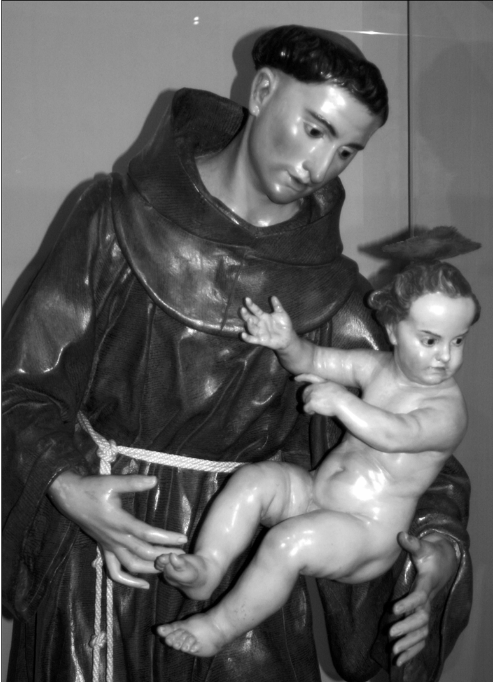
Fig. 5. Francisco Salzillo, San Antonio de Padua (detalle), Vélez Rubio (Almería), Iglesia Parroquial de Nuestra Señora de la Encarnación.