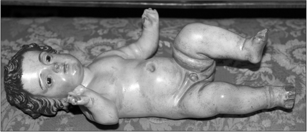
Fig. 14. Anónimo, Niño Jesús , Vélez Rubio (Almería).

de Lorca, además de un San Blas «...de seis palmos, estofado (y) con peana...» también de 1795 y desgraciadamente desaparecido como el resto de las obras citadas.