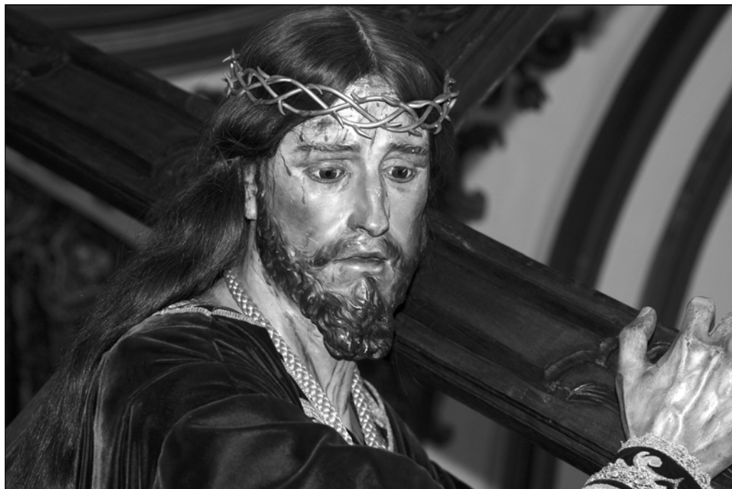
Fig. 2. Francisco Salzillo, Jesús Nazareno (detalle), Huércal-Overa (Almería), Iglesia Parroquial de Nuestra Señora de la Asunción.

roco español por la preocupación de transmitir la fe y la devoción a través de las expresiones y su rigurosa plasticidad. Cristo hecho hombre, que carga humildemente la cruz del martirio sobre su hombro izquierdo, aún abandonado en una indescriptible melancolía perdona a quién lo mira y salva sus almas a través del amor, gracias divinas que Salzillo hace patentes en esta escultura devocional por medio de la fuerza creativa que liga lo inmaterial con lo material, cualidad que constituye el fundamento de su arte.