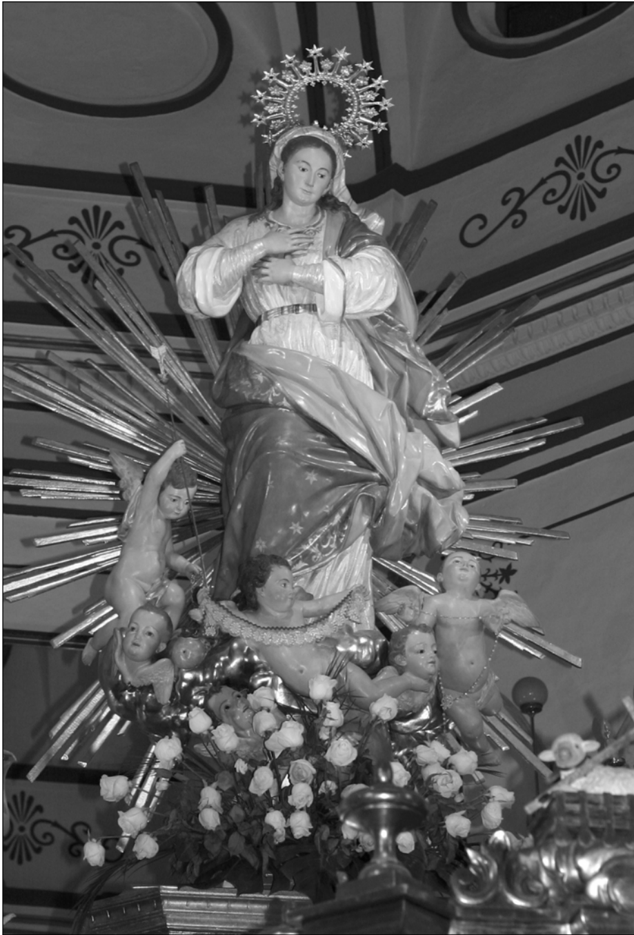
Fig. 15. Francisco Fernández Caro (atribuida), Inmaculada Concepción , Vélez Rubio (Almería).