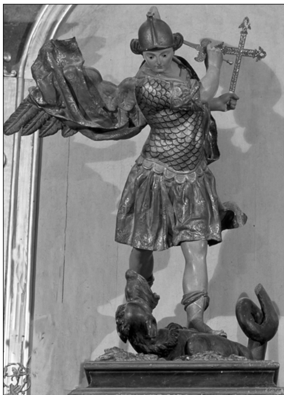
Fig. 12. Roque López, San Miguel Arcángel , Huércal-Overa (Almería), Iglesia Parroquial de Nuestra Señora de la Asunción.