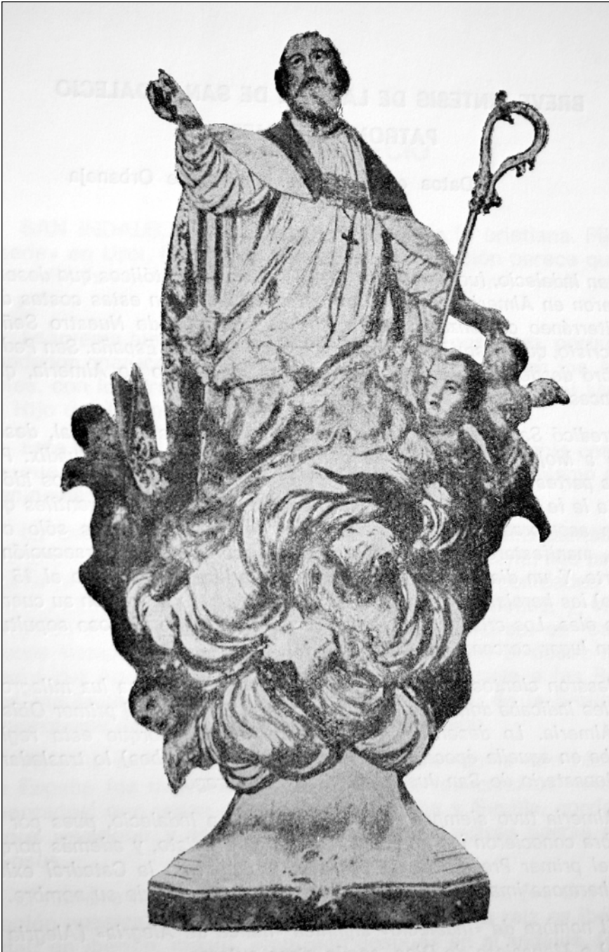
Fig. 9. Francisco Salzillo, San Indalecio (desaparecido), Almería, Catedral.