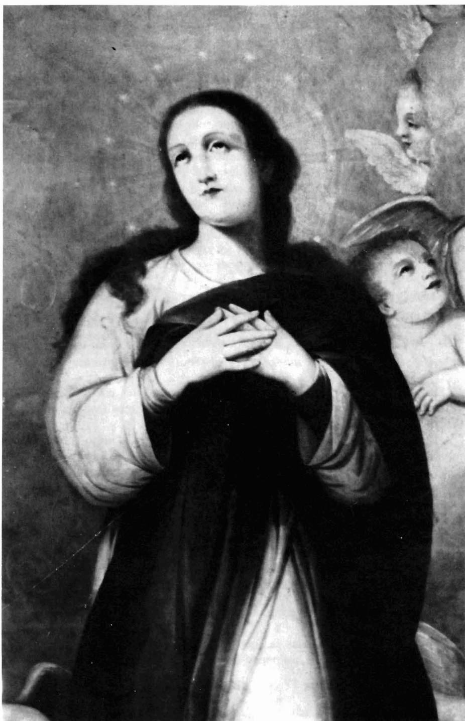
Figura 3. Inmaculada. Detalle.