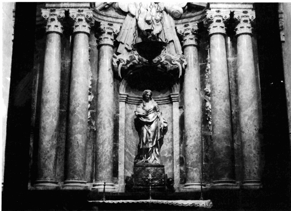
Córdoba. Catedral. Retablo de Santa Inés.

des culturales y económicas de gran interés. Entre las primeras hay que reseñar la creación del Colegio de la Purísima Concepción por parte del deán don Francisco Fernández de Córdoba o la renovación de los planes de estudio del Seminario de San Pelagio, en este caso por don Francisco Isidoro Gutiérrez Vigil y el arcediano de Pedroches don José Medina y Corella. En el orden benéfico y social sobresale el citado arcediano como fundador del Monte de Piedad de Córdoba 5 .