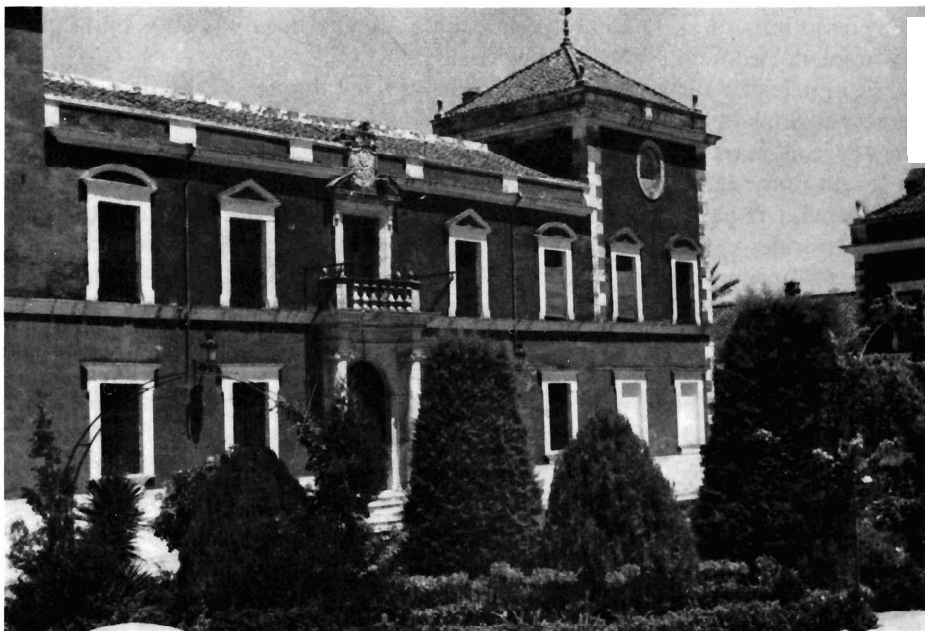
Fernán Núñez. Palacio ducal. Fachada.