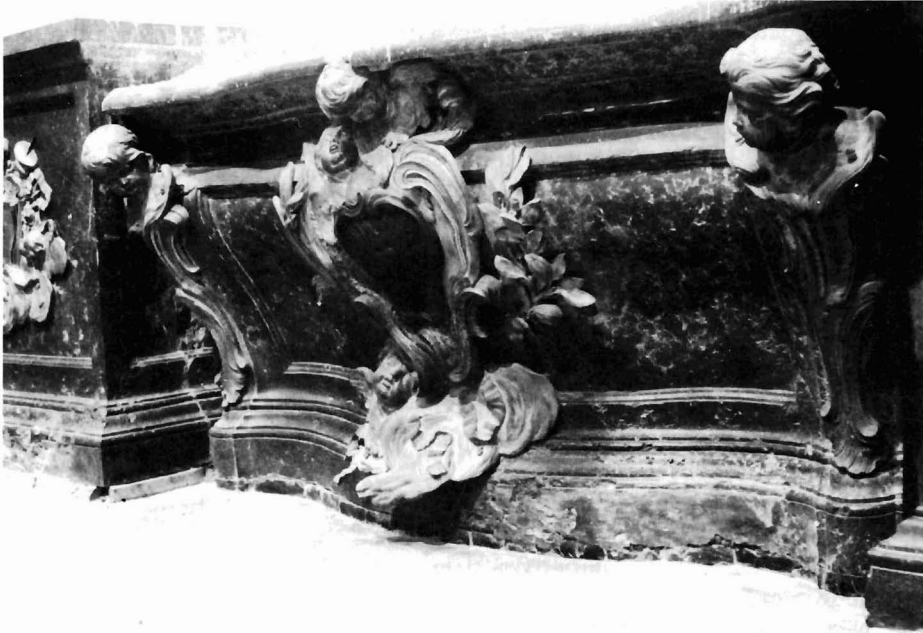
Córdoba. Catedral. Retablo de Santa Inés. Frontal del altar.

otro lado, además de unas deliciosas cabezas de ángeles dispuestas asimétrica- mente arriba y abajo. No menos graciosas son las cabecillas de las esquinas, bajo las cuales se despliegan unas rocallas que tienen por misión proteger los bordes de la mesa, al tiempo que hacen más complejo su juego de curvas.