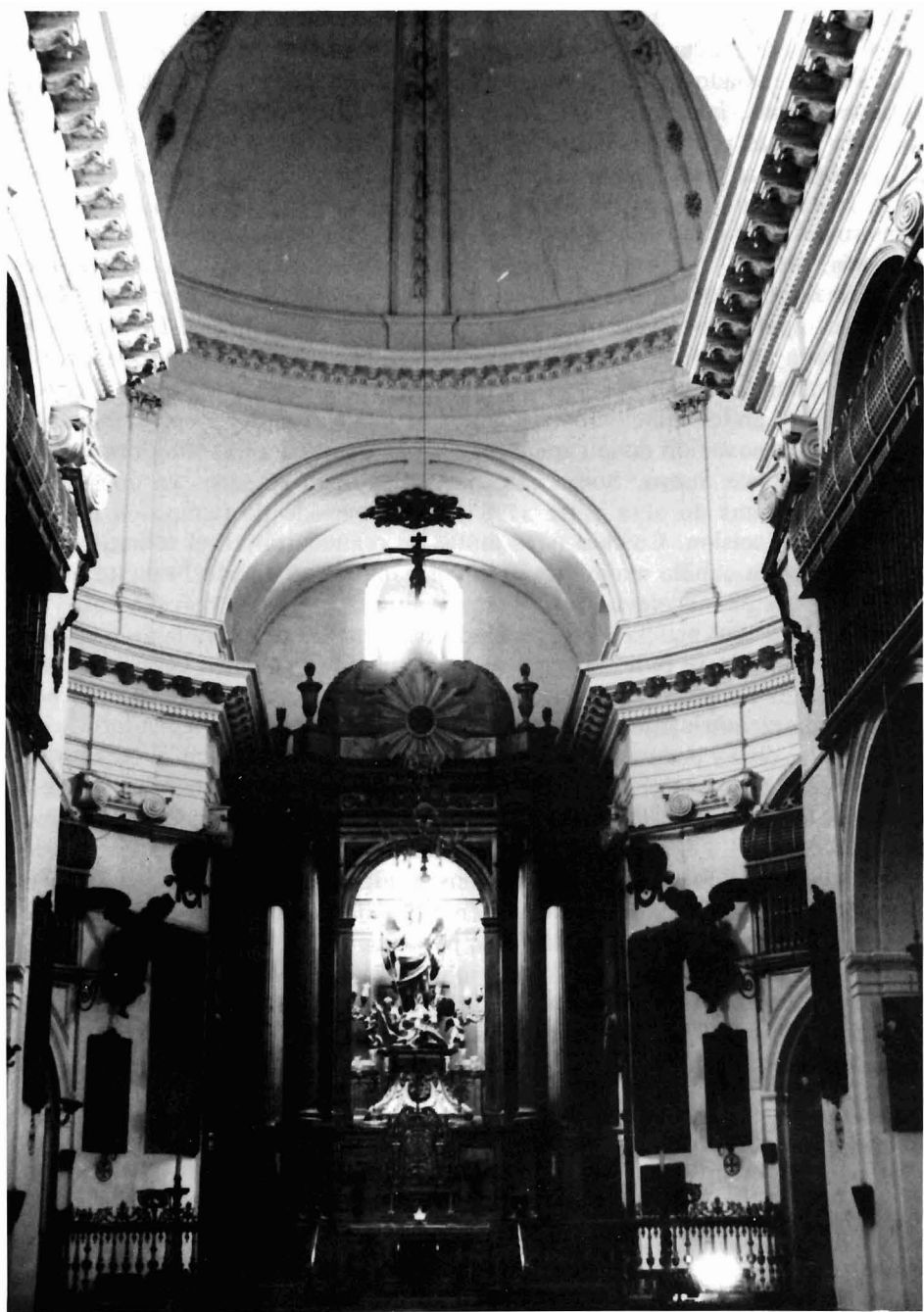
Córdoba. Iglesia de San Rafael (Juramento). Interior.