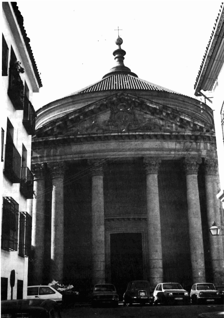
Córdoba. Colegio de Santa Victoria. Pórtico de la iglesia.