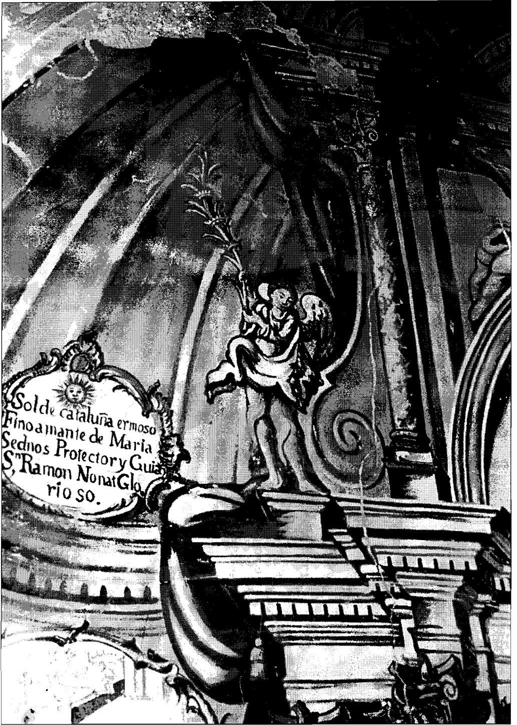
Lam. 4.- Parte superior del retablo.