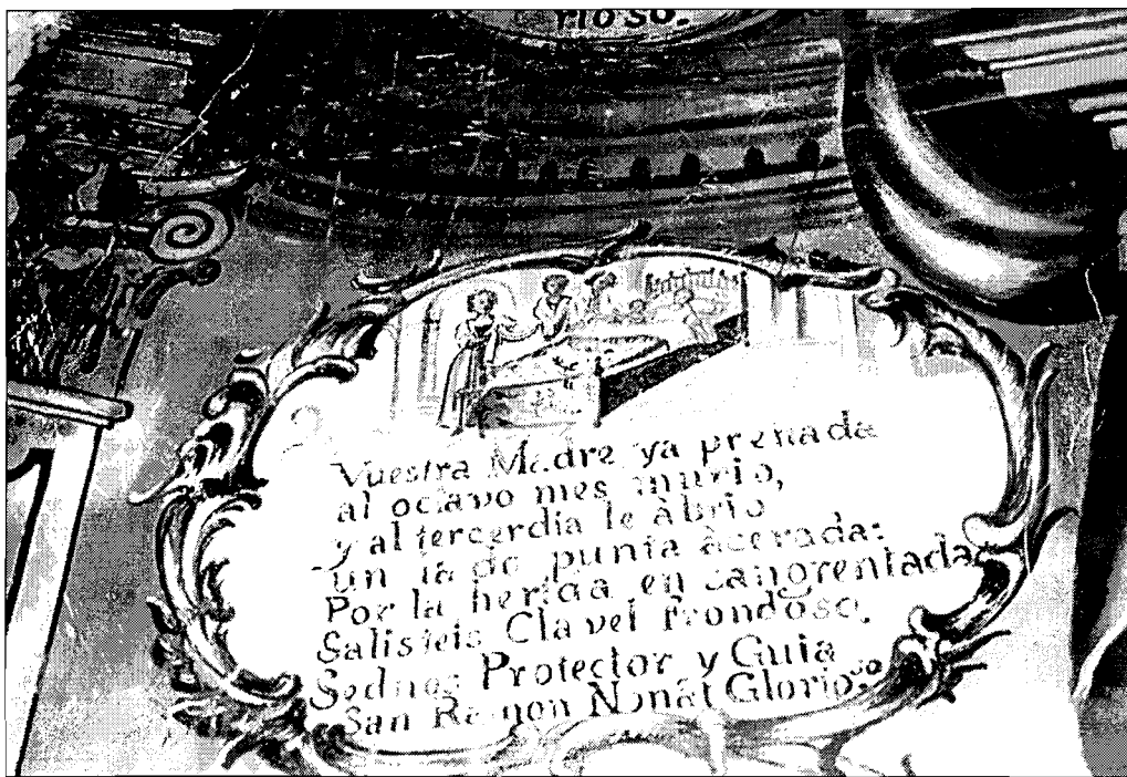
Lám. 2.- Cartela número 2. Nacimiento de S. Ramón.

des 22 . En la actualidad se conservan ocho de las diez cartelas que originariamente componían el retablo, ya que las dos que corresponden con el banco están ocultas por una reciente capa de pintura. En todas ellas aparece un texto que relata el hecho representado y que termina con una petición al Santo 23 , ya que esta composición se cantaba cada día al terminar la novena, pidiéndole al Santo su protección.