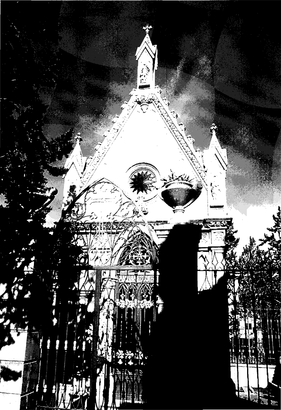
Lám. 3.- Panteón de la familia Izquierdo