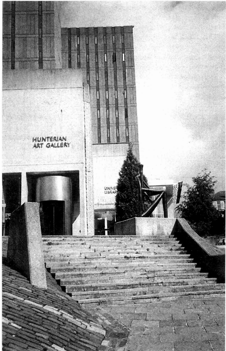
Lám. 2. Hunterian Art Gallery, Universidad de Glasgow. Se encuentra junto a la Biblioteca y posee fondos muy interesantes, como dibujos y grabados de Whistler, y la reconstrucción de la casa de Ch. R. Mackintosh.

Los museos universitarios forman otro grupo importante siendo el Reino Unido un país pionero en la fundación de museos de este tipo, como supuso la fundación del Ashmolean de la universidad de Oxford, el más antiguo de todos. Hay alrededor de unos trescientos museos y colecciones de carácter univesitario. Se financian a través de los recursos gubernamentales que otorgan los Departamentos de Educación y de un organismo específico (Universities Funding