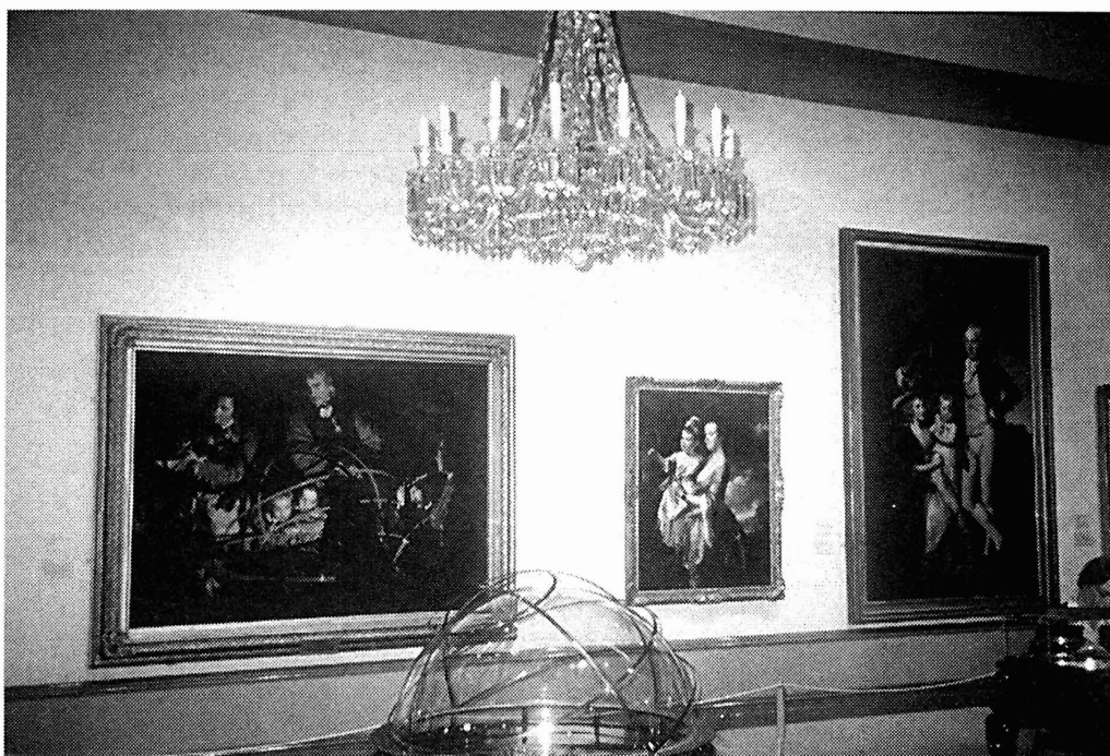
Lám. 6. Derby Museum and Art Gallery. Sala dedicada al pintor Joseph Wright (1734-1797).

constituyó una asociación independiente, los Usuarios de MODES, para continuar desarrollando e implementando este programa 16 .