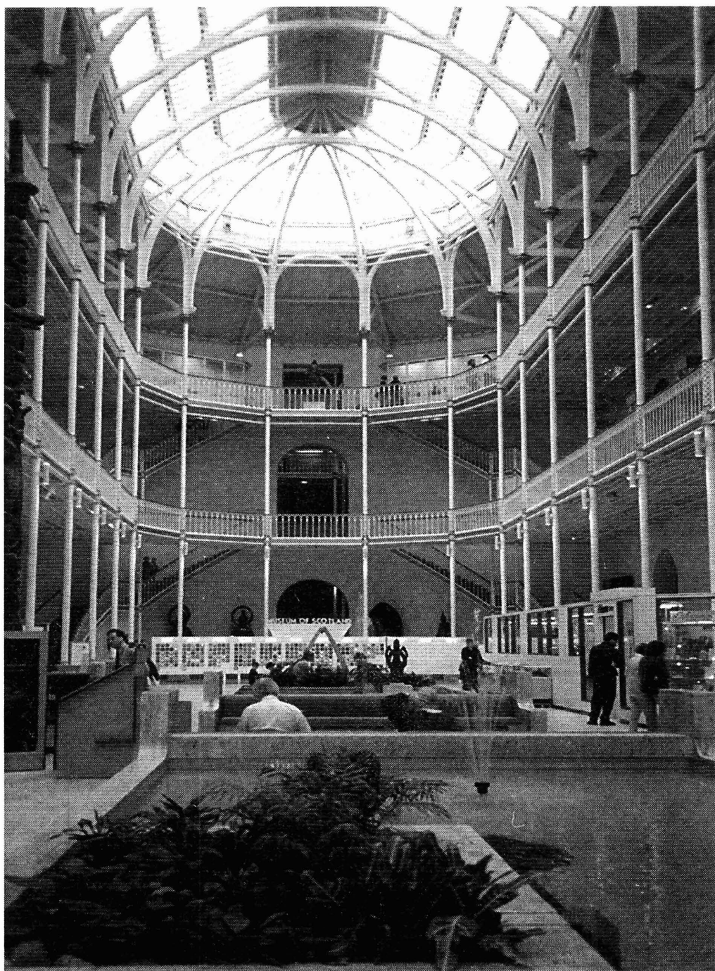
Lám. 5. Museo Nacional de Escocia, Edimburgo.