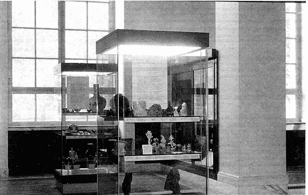
Lám. 4. Museo Británico. Interior.