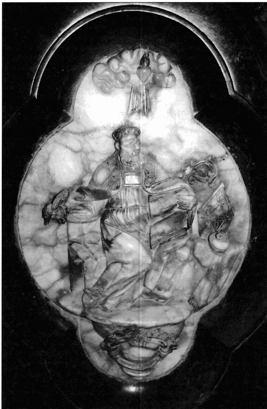
Ilustración 6 Padre de la Iglesia. Relieve.