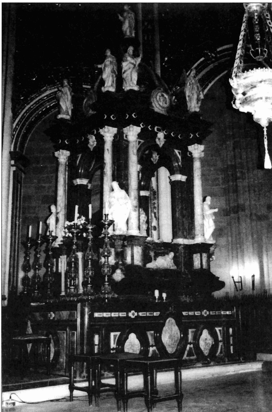
Ilustración 2. Tabernáculo de la Catedral de Almería.