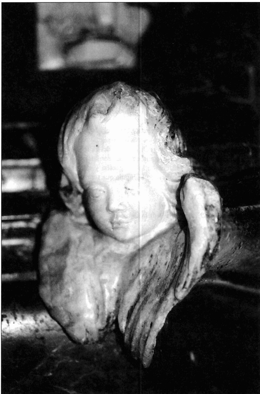
Ilustración 8. Cabeza de ángel.