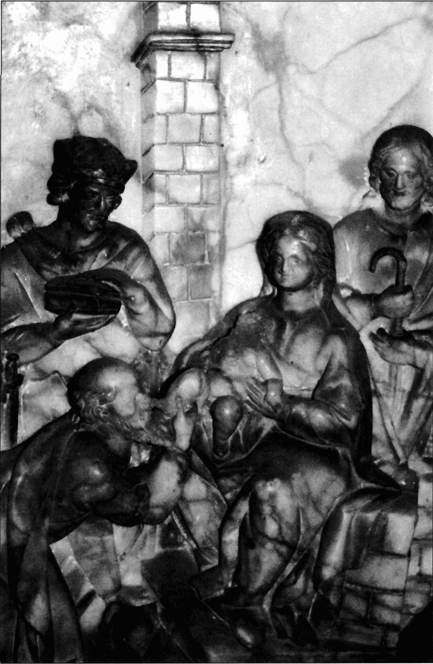
Ilustración 4. Relieve de la Adoración de los Reyes (detalle).