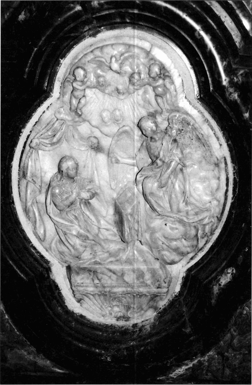
Ilustración 3. Relieve de la Anunciación.