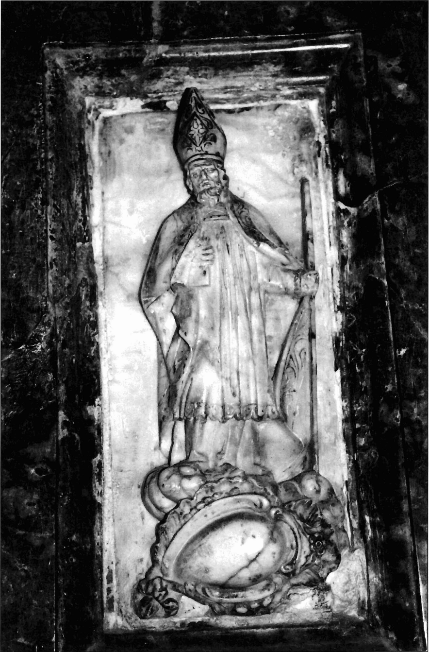
Ilustración 7. Santo Obispo. Relieve.