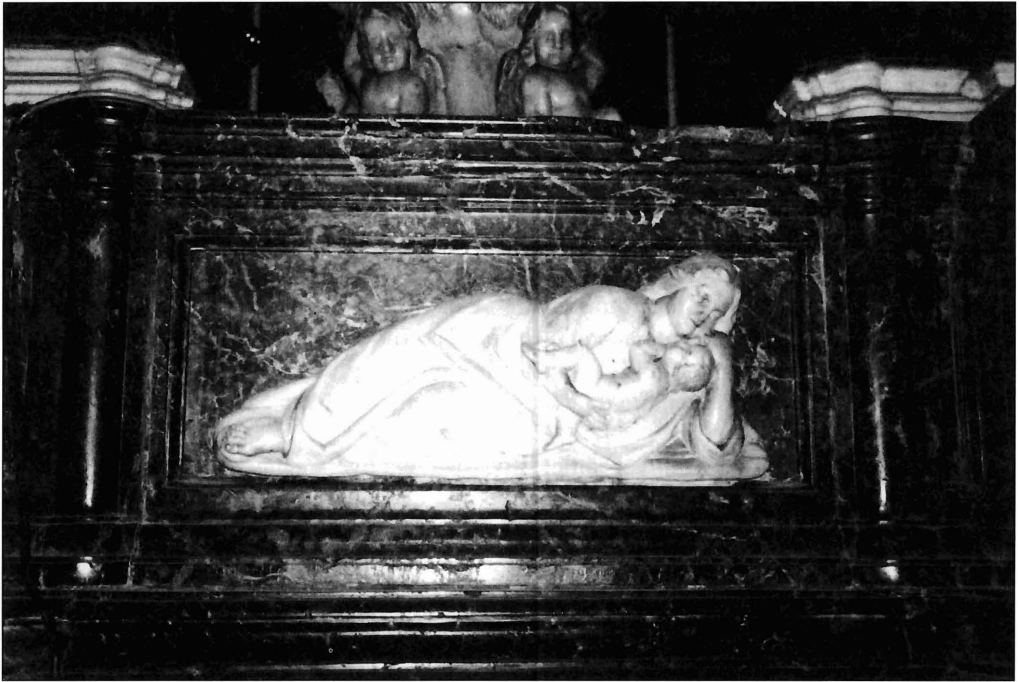
Ilustración 5. Relieve de la Caridad.

en el contrato han de ser de piedra de Escúzar, relieves labrados en alabastro procedente de dicha cantera granadina. En ellos se representan, y por este orden, el misterio de la Encarnación, cuyo tema ocupa el medallón de mayor tamaño situado en el eje de la frontalería anterior, acompañado por otros dos relieves con las efigies de san Mateo y san Marcos; en el frontal del lado de la Epístola, la escena representada es la de la Natividad y junto a ella aparece en sendos medallones las imágenes de san Gregorio Magno y san Jerónimo; en la parte posterior del mueble se figura la Adoración de los Reyes y los evangelistas san Lucas y san Juan y, por último, en el frontal del lado del Evangelio, se sitúa la representación del misterio de la Resurrección de Cristo acompañada por san Agustín y san Ambrosio de Milán.