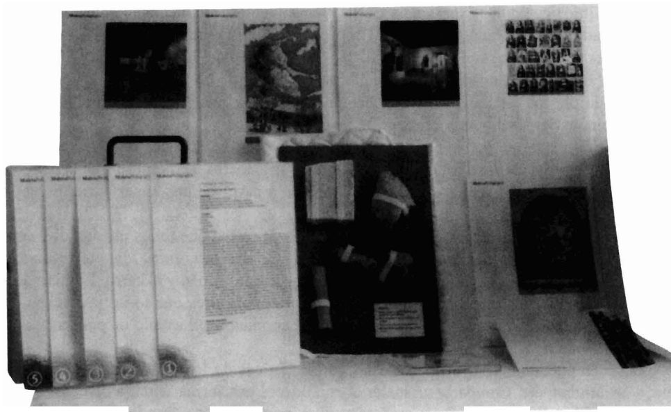
Lámina 3. Tabla de muestras, documentos de apoyo visual y otros de los materiales.