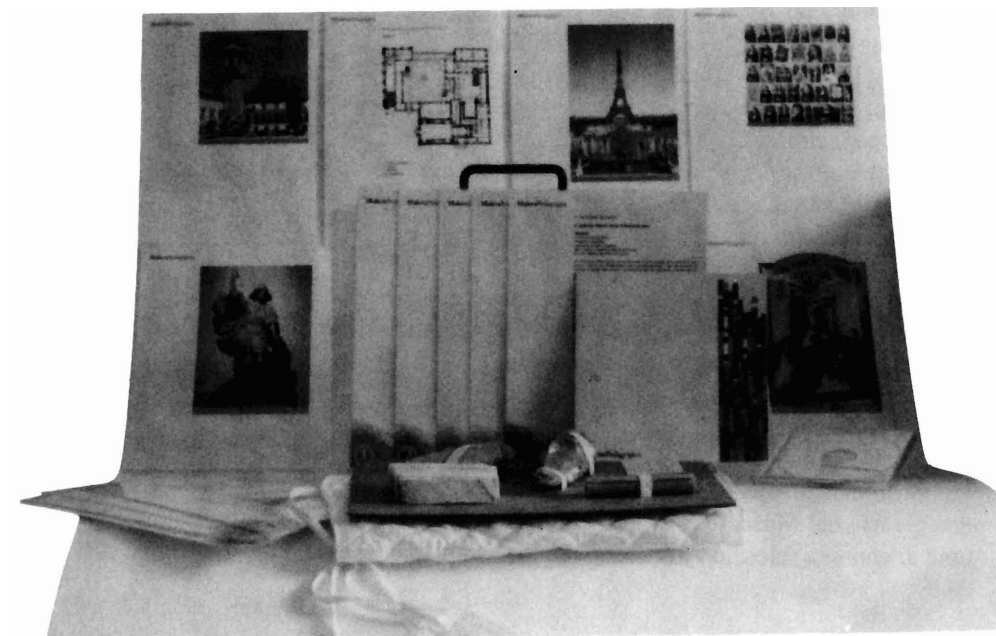
Lámina 1. Conjunto de los materiales de la Maleta Pedagógica .

Las fichas de orientación constituyen el principal material de trabajo del preparador de la visita. Cada ficha presenta los objetivos, conceptos, materiales necesarios y un posible desarrollo de las sesiones, que tienen lugar tanto en la escuela como en el museo, y conforman el programa de visita.