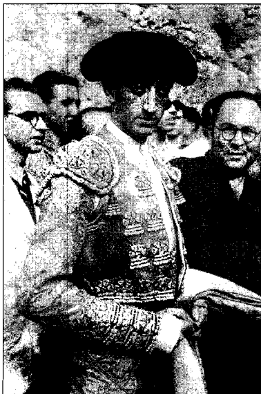
Lámina 1.

La labor como fotógrafo profesional de Juan López Hernández abarca más de medio siglo, entre la década los años treinta a la de los ochenta del siglo XX. No obstante fue después de la Guerra Civil, cuando su actividad alcanzó un notable desarrollo. extendiéndose su trabajo durante los años posteriores.