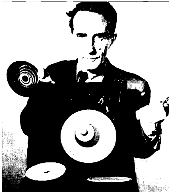
Duchamp y sus discos para la rotativa 1926. (Discos giratorios destinados a producir efectos ópticos con una tecnología elemental)

protegidos, por tanto el cristal era una forma de conservarlos a la vez puros y bastante tiempo sin cambios». 16