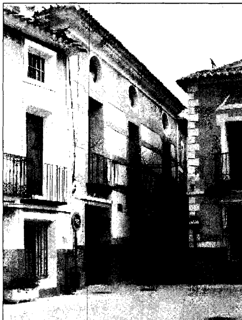
LAMINA 4. Casa de la Calle Posada, nº 1, fachada que da a la Plaza Mayor

Se ha señalado que este tipo de colores se aplicaba para ahuyentar los insectos, aunque también se justifica como remedio para absorber los rayos solares, contribuyendo a impedir que sus reflejos penetren en la vivienda, especialmente en los casos en los que se incorporan azulejos. 46 Los revocos en color dotan a estas viviendas de un aspecto más alegre y vistoso.