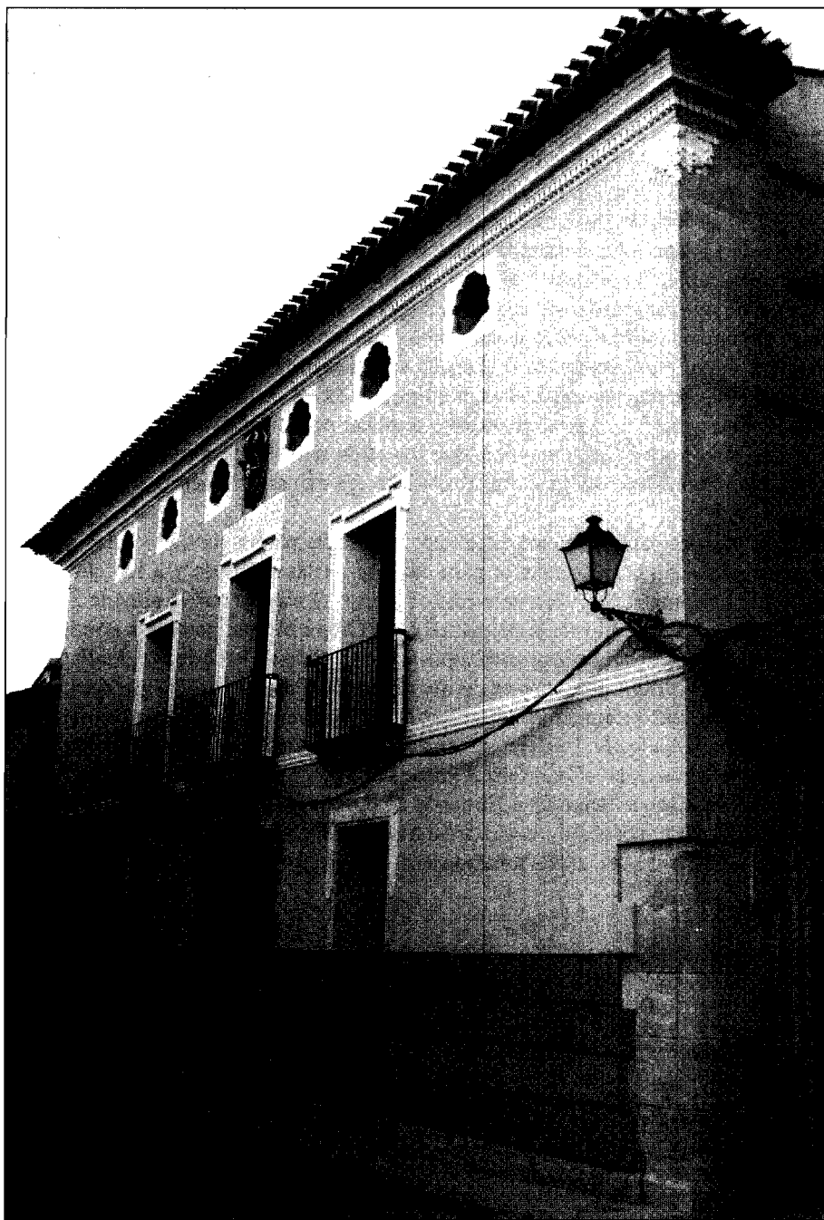
(LÁMINA 5 «Casa de la Tercia», Pliego 1802 )