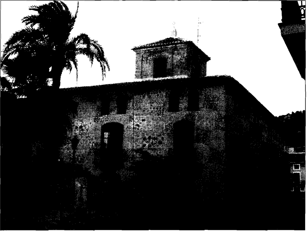
LAMINA 3. «Casa grande» vista desde la calle mayor.

verdugadas de ladrillo, es cierto que durante el siglo XVIII muchos edificios de cierto carácter, como vivieridas y palacios de la alta burguesía o de la nobleza, así como edificaciones públicas, presentaban sus fachadas realizadas con ladrillo, que podía ir también alternando con mampostería..” Pero todo parece indicar que en este edificio la mampostería, al igual que en otros ejemplos, hubo de recibir el «jarrado» que consistía en cubrir las paredes con una corteza de mezcla de cal y arena o sólo de yeso, que no contribuye a la solidez del paramento pero ayuda a su conservación, a la vez que oculta todos los defectos de la construcción. 34 Sobre éste se podían hacer «los blanqueos, revocos y últimos pulimentos de la obra». 35 Antes de la