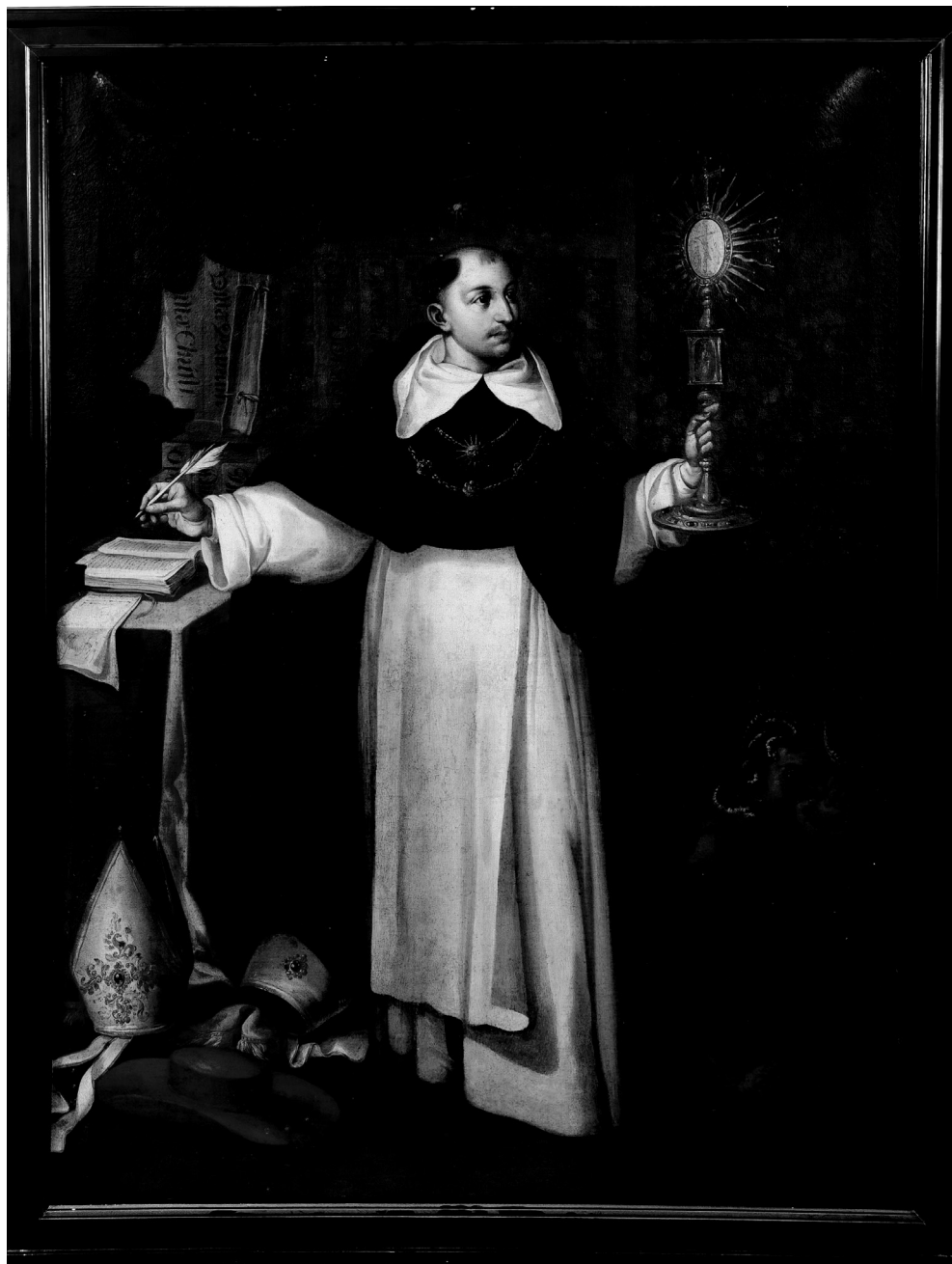
Figura 8. Alonso del Arco, Santo Tomás de Aquino , Colección particular.