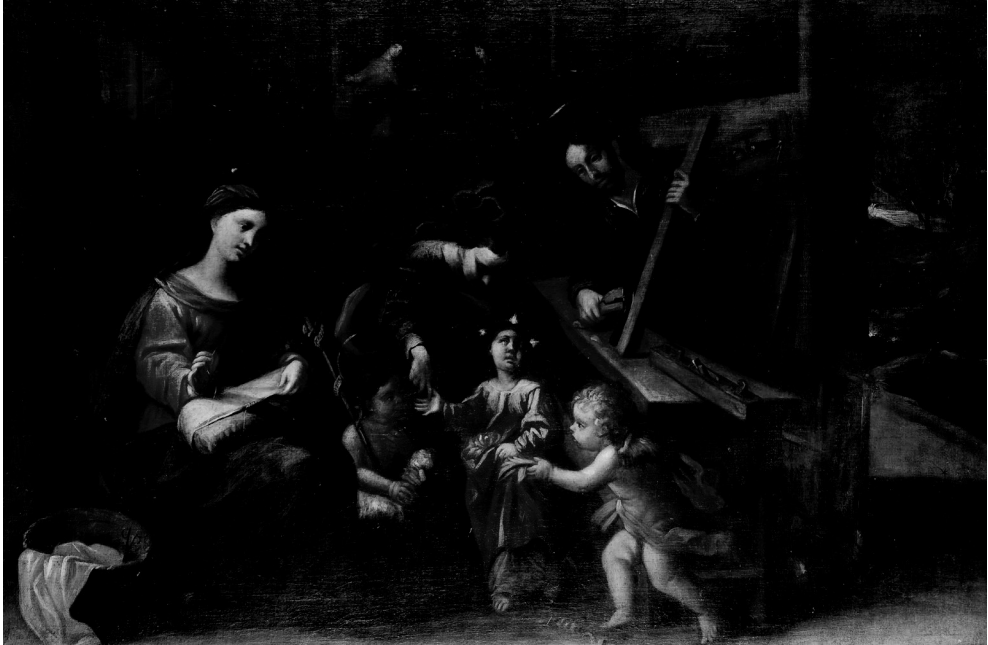
Figura 3. Alonso del Arco, Sagrada Familia en el taller de Nazaret , Colección particular.

Mucho más interés tiene el lienzo con el tema de La Sagrada Familia en el taller de Nazaret vendido hace algunos años 44 (Fig. 3). Está firmado en el ángulo inferior izquierdo al lado del cestillo con los útiles de costura. Como resulta habitual en este tipo de iconografía, el pintor concibe la escena en el interior de una estancia con un tono costumbrista e intimista. El Niño juega con San Juanito y un ángel que recoge las virutas de madera producidas por el trabajo de San José que, rodeado de las herramientas de carpintero, desbasta un tablón con una azuela. La Virgen, de delicada expresión serena y recogida, cose plácidamente mientras observa la escena, al igual que San José. La estancia está enmarcada por una ventana a la izquierda y al fondo de aprecia una Anunciación. A la derecha se abre un paisaje. Es evidente que el cuadro tiene sus limitaciones técnicas de dibujo y composición, con defectos perspectivos, pero en general resulta agradable y tiene un cierto toque particular que lo hace atractivo. De este tema se conoce otro ejemplar con algunas variaciones