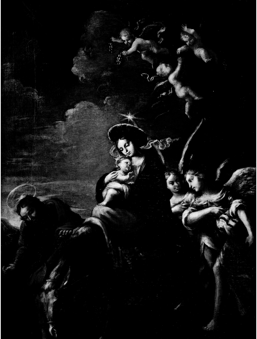
Figura 2. Alonso del Arco, Huida a Egipto , Colección particular.