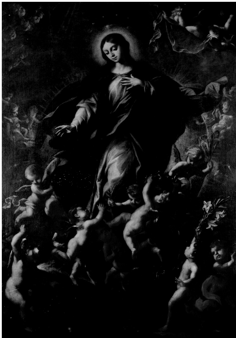
Figura 1. Alonso del Arco, Inmaculada , Colección particular.

último eslabón en las Inmaculadas fechadas de Alonso del Arco, desde la inicial de 1674 (jesuitas), pasando por las de 1682 (Álava), 1683 (Prado), 1687 (la desaparecida de la Universidad de Oviedo) y 1689 (ermita de la Virgen de la Oliva) 19 .