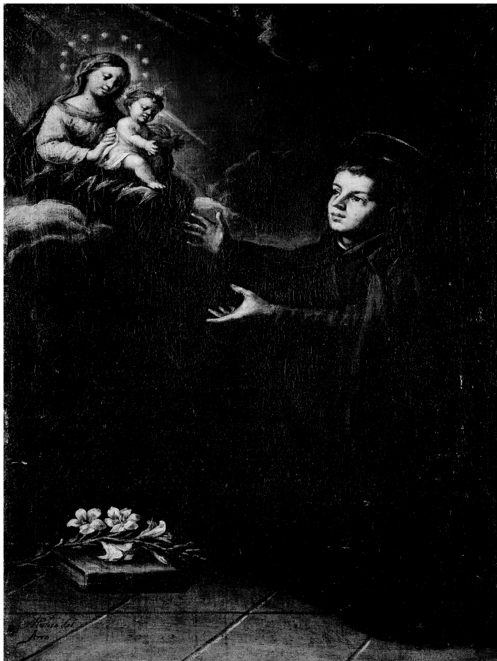
Figura 5. Alonso del Arco, Aparición de la Virgen a San Estanislao de Kostka , Colección particular.