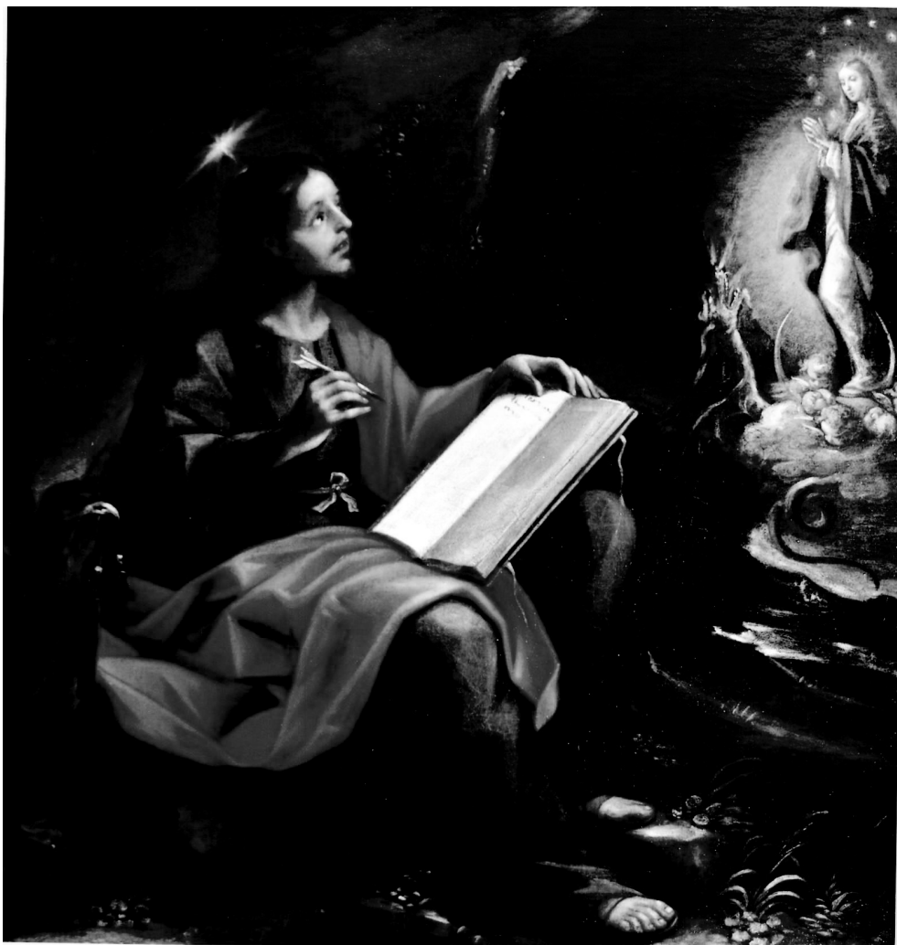
Figura 6. Alonso del Arco, San Juan en Patmos , Colección particular.

Un San Juan en Patmos firmado que fue de la colección Granados debe ponerse en relación directa con el –casi idéntico– que está en el retablo colateral del convento de San José de Ávila 68 (Fig. 6).