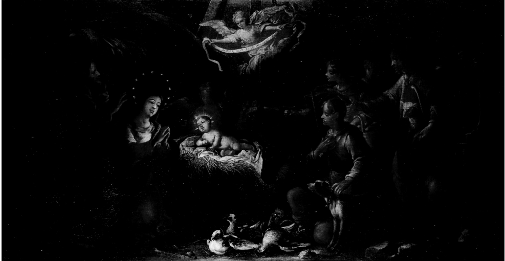
Figura 10. Antonio Castrejón, Adoración de los pastores , Colección particular.

Por lo demás, como ya se indicó, hay constancia documental de que ambos pintores participaron de manera subsidiaria en las frecuentes decoraciones efímeras que se realizan en Madrid con motivo de la celebración de diferentes fiestas o acontecimientos tales como entradas reales, exequias, decoraciones teatrales para el coliseo del Buen Retiro o el Salón Dorado del Alcázar, fiestas del Corpus, etc 103 . Por ejemplo las decoraciones efímeras realizadas con ocasión de la entrada en Madrid de María Luisa de Orleans, e incluso la realización de tareas pictóricas menores como un estandarte que se sacaba en las procesiones de San Isidro 104 . En este sentido trabajaron junto a otros artistas cortesanos del Madrid del momento como Francisco Ignacio Ruiz de la Iglesia, José García Hidalgo o Pedro Ruiz González; además de los de primerísima fila como Juan Carreño de Miranda, Francisco Rizi, Claudio Coello, José Donoso o Matías de Torres. El estudio de las relaciones entre ellos ayuda a conocer mejor su participación en obras cortesanas, así como a profundizar en el conocimiento del intrincado y estrecho mundo artístico madrileño del momento 105 .