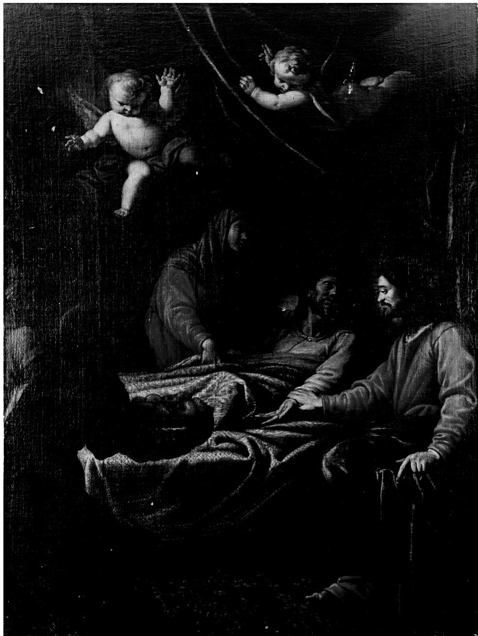
Figura 4. Alonso del Arco, Muerte de San José , Colección particular.