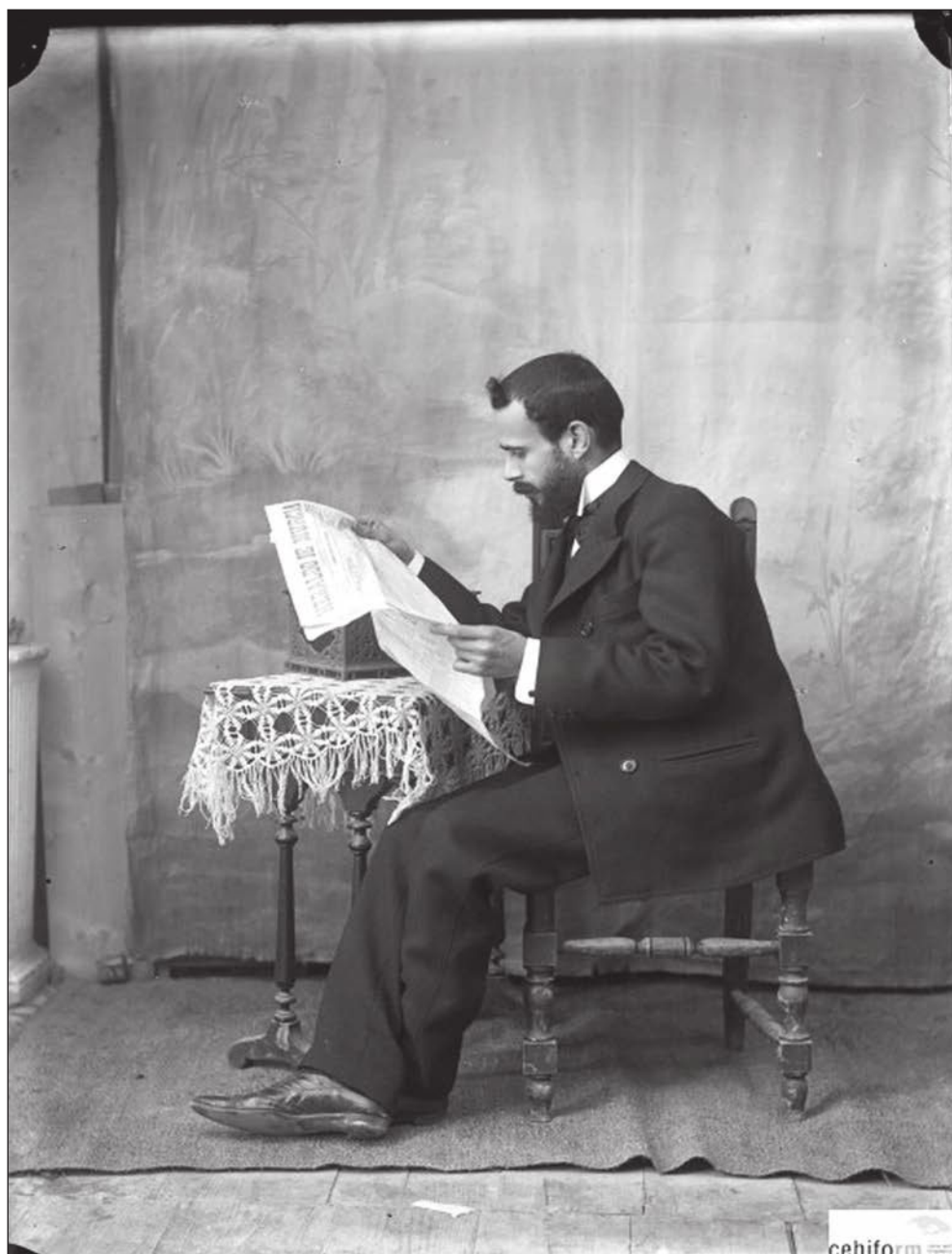
Lámina 7. Fernando Navarro. Sin Título. Ca. 1890.