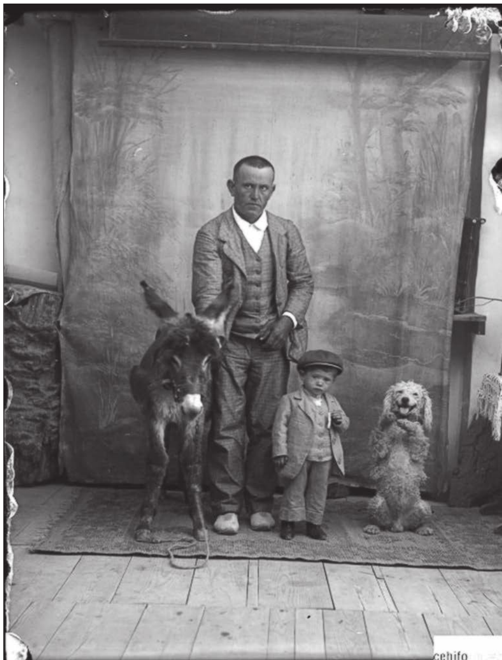
Lámina 6. Fernando Navarro. Sin Título. Ca. 1890.