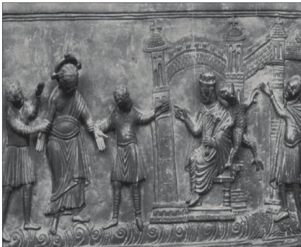
Figura 3. Puertas de San Miguel de Hildesheim, siglo XI (actualmente en la catedral de Hildesheim).

Este terrible papel quedará reservado a los judíos en el arte de la Baja Edad Media. El arte italiano bajomedieval recibió la herencia del arte bizantino no sólo en su estilo, sino también en su iconografía, por lo que es frecuente encontrar la escena del juicio ante Pilatos con el romano representado como un rey medieval e inducido por un malvado judío con larga barba y capucha a condenar a Jesús 23 . Lo mismo ocurrirá en el arte catalán de influencia italianizante. Unas pinturas murales del monasterio de Pedralbes de la primera mitad del siglo XIV han sido tradicionalmente atribuidas a Ferrer Bassa, aunque hoy se propone que podrían haber sido realizadas por un pintor italiano contratado por este pintor 24 . En la escena del juicio de Pilatos observamos al