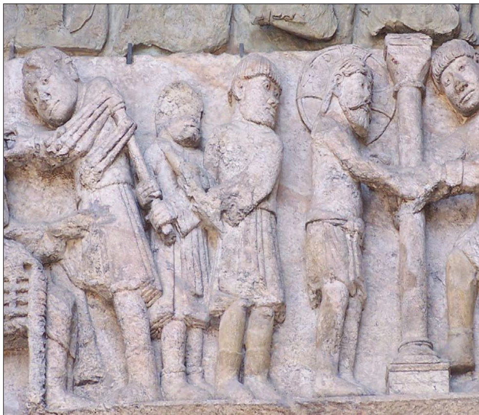
Figura 1. Pórtico de las Platerías, siglo XII. Santiago de Compostela

En esta carta Pilatos se muestra en todo momento como un devoto y ferviente cristiano, enfurecido con los judíos por haberlo engañado para que condenase a Jesús.