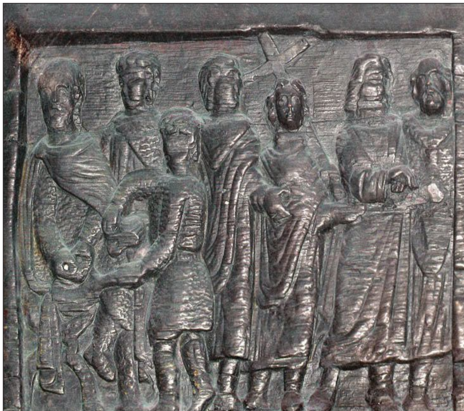
Figura 2. Puertas de Santa Sabina, siglo V. Roma.

En una escena de la Flagelación, el gobernador romano espetará incluso a los judíos que se encarguen ellos de dicha labor, cosa que él no estaba dispuesto a hacer, puesto que se había opuesto a castigar a Cristo 17 .