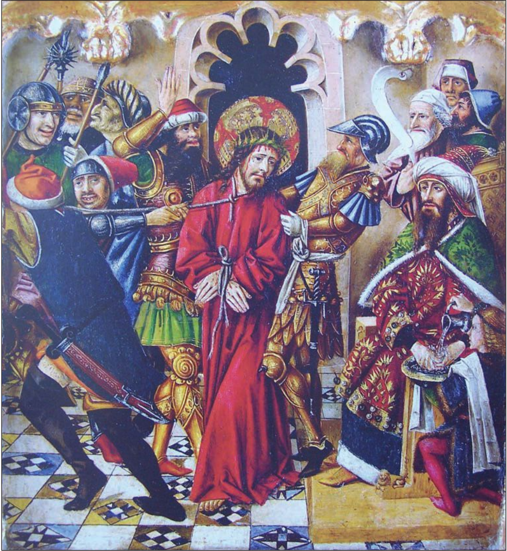
Figura 6. Predella de Joan Reixach, siglo XV. Museo de Bellas Artes de Valencia.

Uno de los momentos que mejor ilustran la voluntad de Pilatos por librar a Cristo de la pena capital y su imposibilidad de hacerlo ante la insistencia de los judíos para que muera en la cruz es el instante en el que el romano exhibe a Jesús después de haber sido azotado y torturado ante los judíos diciendo: “ Ecce homo ”; es decir, “He aquí el hombre”. Con ello, el prefecto romano agotaba un último intento frustrado de