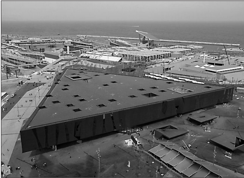
Fig. 2: Jacques Herzog y Pierre de Meuron. Edificio Fórum (vista aérea). 2001-2004. Barcelona (España).

que, para la finalidad de encuentro con la que es creada (auditorio, salas de conferencias, zonas de exposición y restauración...), facilite la comunión, la interrelación y el diálogo entre los visitantes, resultando más acogedor para ello un edificio plano que se expande en superficie y que, con sus tres vértices, actúa como una ola que arrastra a cuantos se acercan a ella. Además, hay que tener presente que en los países mediterráneos es común desarrollar parte de la vida diaria en las calles, lo que hace a los ciudadanos partícipes de las actividades que se le ofrecen en ellas. ¿Por qué el edificio de un foro tiene que ser vertical, cuando la extensión horizontal permitiría el contacto entre la gente de un modo mucho más natural y objetivo? 31 , se preguntan Herzog y de Meuron. De ese modo prevén que un espacio con las características de éste armonice mejor con el sentir de los barceloneses quienes, según la confianza suscitada, lo asimilarán como propio en poco tiempo, no viéndolo como un cuerpo ajeno levantado de manera artificial 32 . Si a esta premisa se añade el hecho de que el solar disponible presentaba, a priori, una disposición casi triangular, no es de extrañar el resultado visible, pese a que no deje de resultar una morfología curiosa y atípica tanto en Barcelona como en la nómina constructiva de los autores suizos.