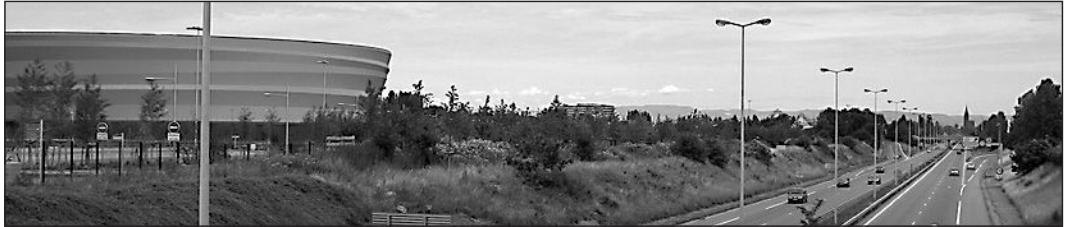
Fig. 6: Massimiliano Fuksas y Dorian Fuksas. Zénith. 2003-2008. Estrasburgo (Francia).

de una lámpara encendida a partir del atardecer, sobre cuya superficie se proyectan videos y textos 57 . Pese a que, a partir de lo comentado, parece evidente el deseo de los autores por crear una obra icónica, seductora y sugerente, en Estrasburgo es la ausencia de cualquier referencia cercana, tanto positiva como negativa, la que polariza el proyecto, cuyo atractivo no se pone tanto al servicio de necesidades externas como de la propia reivindicación del edificio frente a la desabrida autovía junto a la que se construye. Formas y colores materializan iconos y singularizan el espacio, si bien lo que podría parecer un modo de reactivar un dinamismo perdido aquí no es más que la necesidad de no resultar engullido por un contexto inexistente.