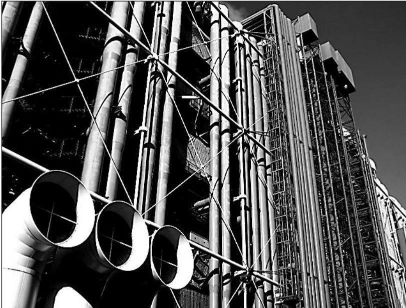
Fig. 1: Richard Rogers y Renzo Piano. Centro Georges Pompidou (detalle del exterior). 1971-1977. París (Francia).