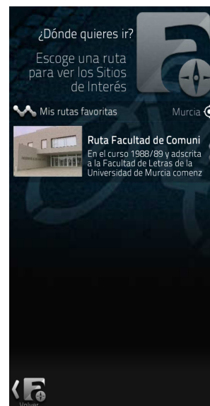
Figura 4: Vista Ruta “Facultad de Comunicación y Documentación”.

Tras localizar la ruta, que en nuestro caso se denomina “Ruta Facultad de Comunicación y Documentación”, se obtiene la siguiente vista: