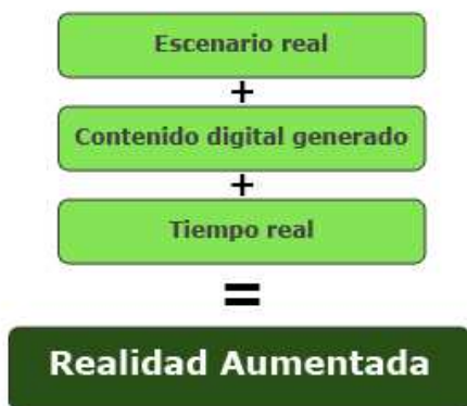
Figura 1: Esquema de la Realidad Aumentada (RA).

“la RA consiste en la incorporación de datos e información digital en un entorno real, por medio del reconocimiento de patrones que se realiza mediante un software, es decir, es una herramienta interactiva que ha pasado de dar sus primeros pasos y que en ya vamos viendo en multitud de ámbitos y disciplinas, trayendo el mundo digital a nuestro entorno real. Combina elementos reales y virtuales, es interactiva en tiempo real y está registrada en 3D” (Azuma, 1997).