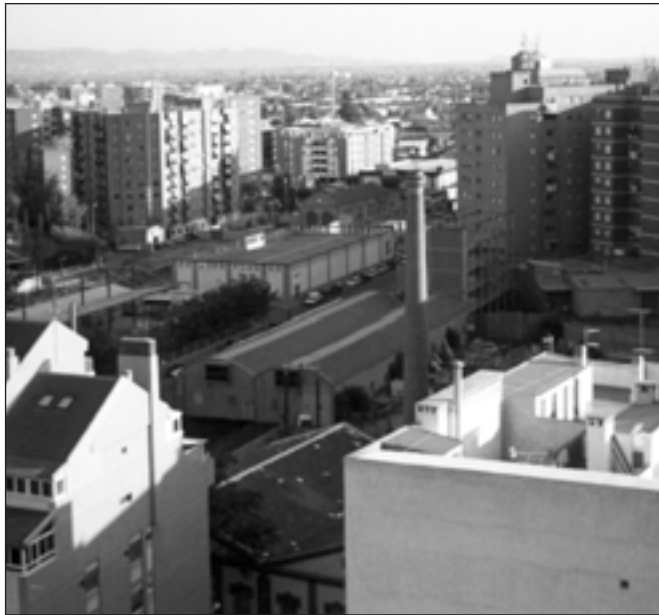
FIGURA 4. Instalaciones de la 'Fundación Poncemar', en la Alameda de Menchirón, ejemplo de antiguo centro industrial y reconvertido hoy en centro administrativo y terciario.

e instalaciones de la «Casa de los Oficios» de formación profesional y las Oficinas Municipales de Empleo; conservándose en el centro la chimenea de ladrillo, que coronaba este complejo industrial, reconvertido en centro administrativo, con lo cual se ha recuperado un espacio inutilizado durante años, para servicio del ciudadano (figura 4):