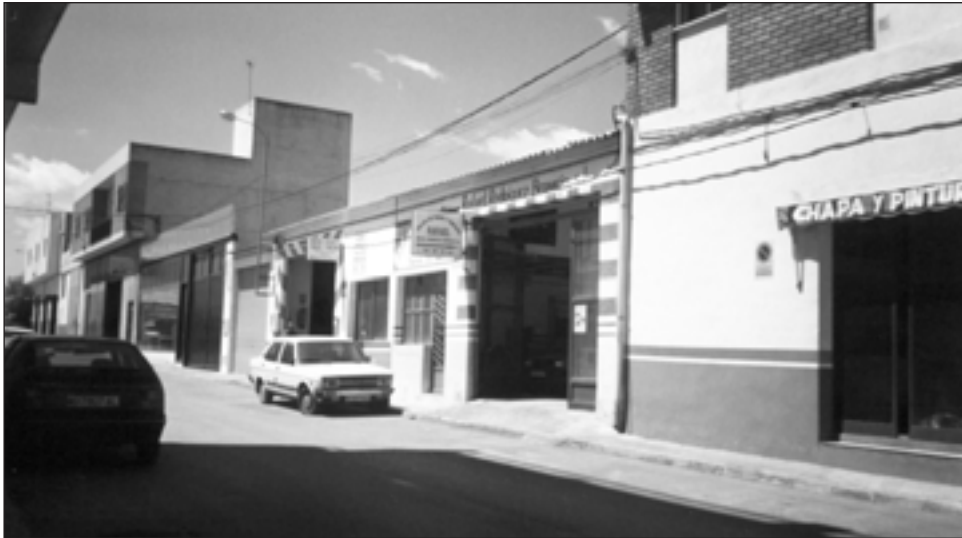
FIGURA 6. La condición de La Viña como barrio periférico ha desencadenado el asentamiento de pequeñas empresas industriales que satisfacen las necesidades del habitante urbano.

La renovación urbana que se ha producido en este popular barrio lorquino en los últimos años y un ejemplo es la Carretera de Granada que ha pasado de ser un corredor industrial hasta los años 80, a una vía bien urbanizada donde las naves industriales han desaparecido y han sido sustituidas por modernas edificaciones para viviendas, aún cuando subsisten algunas instalaciones que han sido reutilizadas para acoger grandes establecimientos comerciales especializados, modelo muy implantado en el contiguo polígono de Los Peñones.