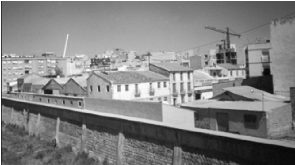
FIGURA 3. Imagen de la calle San Fernando donde se aprecia la degradación que producen las activas y clausuradas instalaciones industriales.

En el vecino barrio de San Diego, hoy en plena fase de expansión urbana y en el que se han construido más de mil viviendas en los últimos años, la presencia industrial es ya inexistente pese al gran peso que tuvo en tiempos pasados. Las pocas almazaras, fábricas de curtidos, de harinas, confección y otras alimenticias que quedaban hasta hace un par de decenios en la avenida de las Fuerzas Armadas, Puente Gimeno o Caballón han desaparecido y han sido sustituidas por modernos bloques de viviendas.