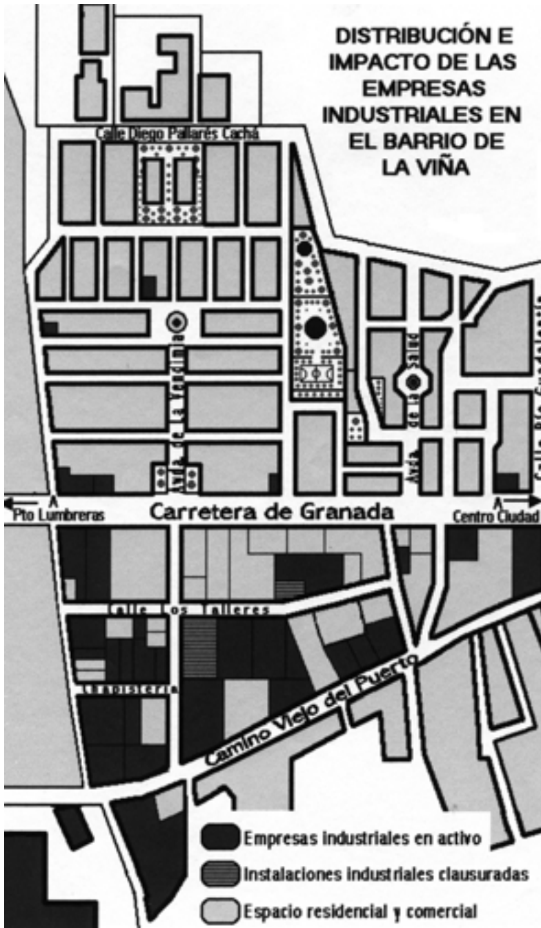
FIGURA 5. Localización e impacto de la actividad industrial en el barrio de La Viña.