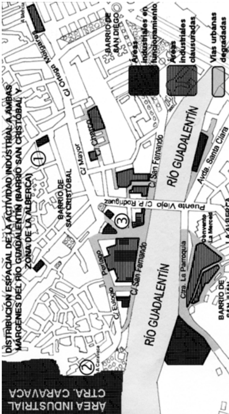
FIGURA 2. Distribución e impacto de la actividad industrial en el barrio de San Cristóbal y en la zona de La Alberca.