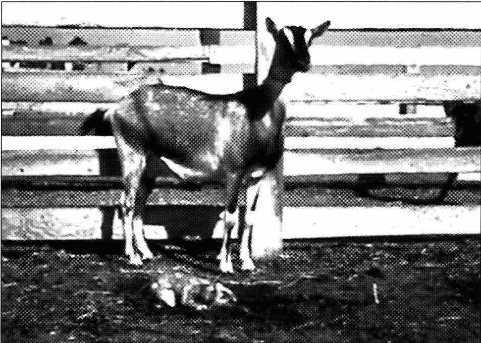
FIGURA 1. El feto de una cabra recientemente abortada contamina el suelo y los pastos de una explotación ganadera.

Recientes estudios sobre la patogenia, llevados a cabo por Anderson et al. (2 y 3) y