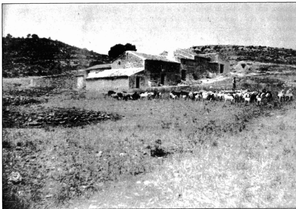
FIGURA 3. Un rebaño de ganado ovino y caprino aprovecha los rastrojos en una zona árida de la región de Murcia a finales del siglo pasado; la imagen se repite todavía con frecuencia en muchos países del mundo.

La ganadería estante es de posterior aparición y se caracteriza por que los rebaños