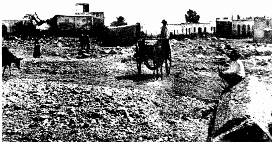
LAMINA 2. Otro aspecto de la desolación que provocó el desbordamiento de las ramblas que cruzan la ciudad (Belén, Alfareros, Chanca), el 11/septiembre/1891 en la capital andaluza.

tan desastrosos resultados habría que buscarlas sobre todo en el cerramiento tan deliberado como inconsecuente de los cauces de las ramblas. La historia se repetirá con exactitud en nuestro siglo actual y en fechas muy recientes,