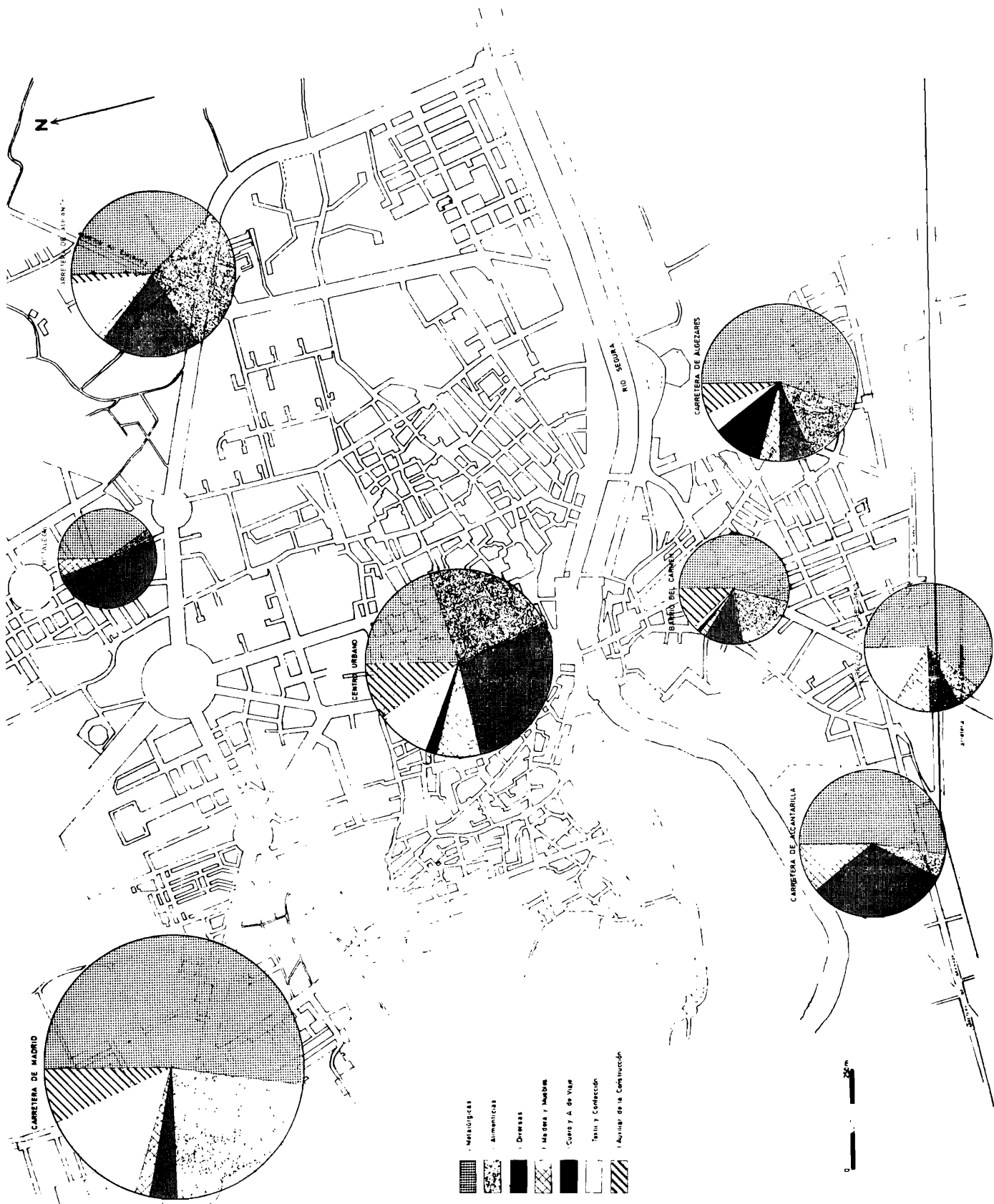
Gráfico n.º 3.—Distribución de los obreros fijos en las zonas industriales