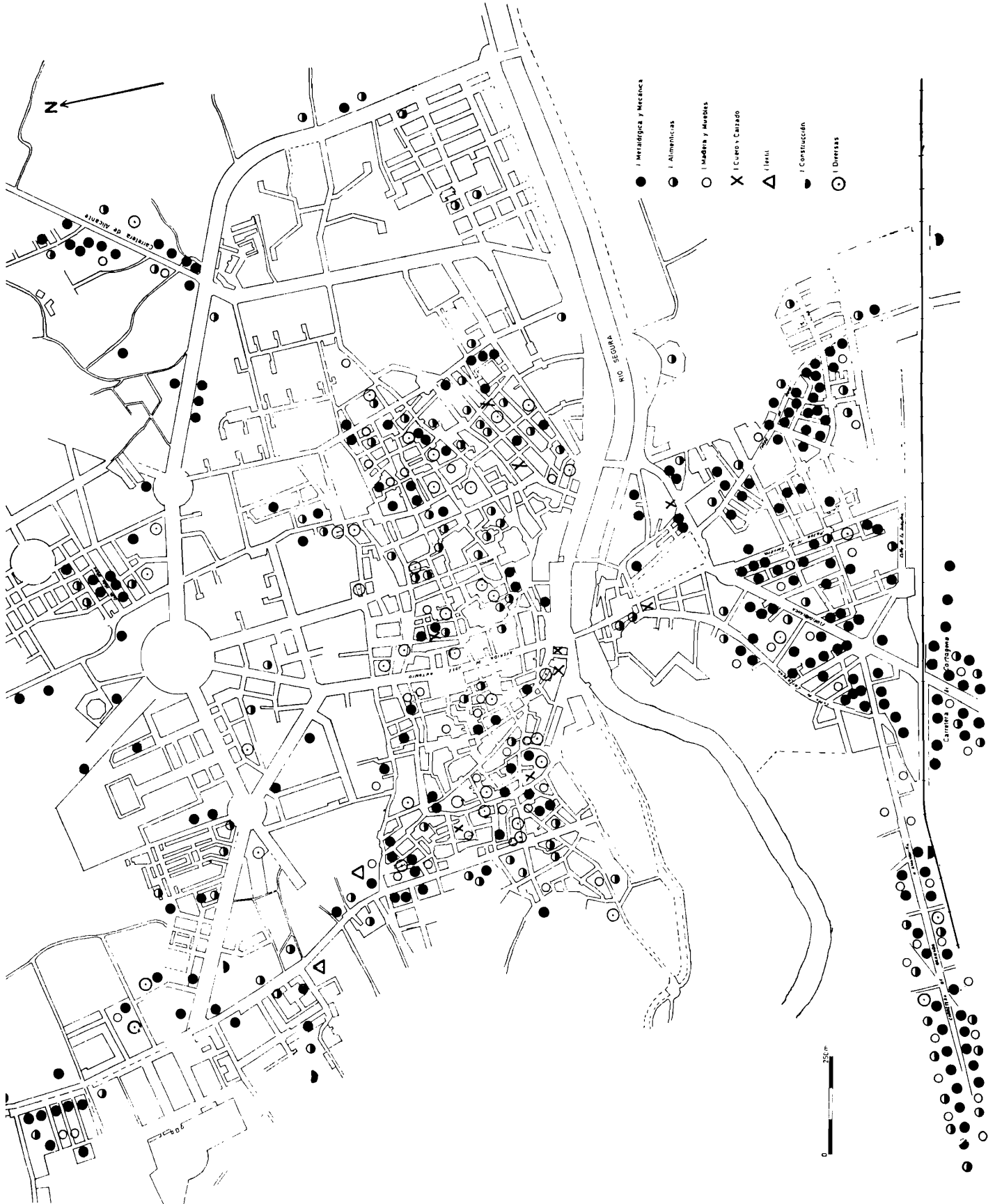
Gráfico n.º 2 — Localización industrial del área urbana de Murcia en 1971.