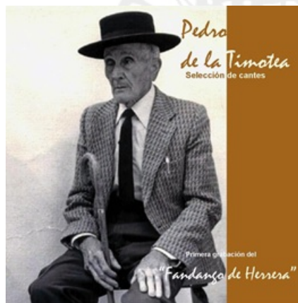
Figura 1. Portada del CD en el que se incluye la grabación del fandango de Herrera

y probablemente única grabación del fandango de Herrera, consiguiendo al tiempo divulgar el patrimonio cantaor de un artista muy querido en su localidad. El objetivo que nos proponemos en este artículo es, pues, dar a conocer una variedad de fandango local que ha estado en serio trance de desaparición y analizar, al tiempo, su relación con el estilo de fandango atribuido a Pérez de Guzmán, y con los zánganos folclóricos de Puente Genil. Planteamos además la hipótesis de que el fandango herrereño pudiera haber sido el modelo en el que se basó el artista extremeño para forjar el suyo. Comenzaremos, hablando de la relación existente entre el primitivo fandango de Herrera y los llamados zánganos de la localidad vecina de Puente Genil.