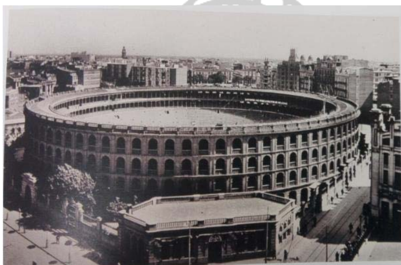
Imagen 6. Villa Rosa en la Plaza de Toros

tan solo hay un par de series (Arrendamientos y Correspondencia) donde al principio parecía que estuviera el nombre del arrendatario pero no figura el de Borrull, probablemente porque el guitarrista lo arrendó en un contrato privado como era común en la época. Finalmente, en los fondos de la biblioteca del Museo Taurino de Valencia se ha podido encontrar el que sería, con toda probabilidad, el café cantante de los hermanos Borrull, el cual se puede apreciar en la siguiente fotografía (imagen 6).