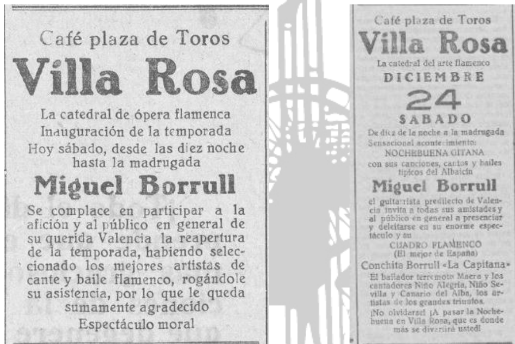
Imágenes 9 y 10. El Villa Rosa, catedral de ópera flamenca

adquiriendo una visibilidad social, creando aficionados y permitiendo una profesionalización de los artistas flamencos. En este sentido, el Villa Rosa fue el lugar de moda y se publicitó como «catedral de ópera flamenca», en una clara rivalidad con el espectáculo de masas (imágenes 9 y 10).