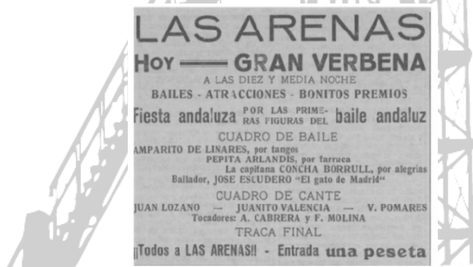
Imagen 12.Las Arenas (Fuente: Las Provincias , 9 de julio de 1932)