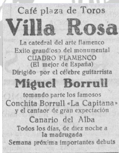
Imagen 11. Anuncio del Villa Rosa (Fuente: El Pueblo , 29 de diciembre de 1932)