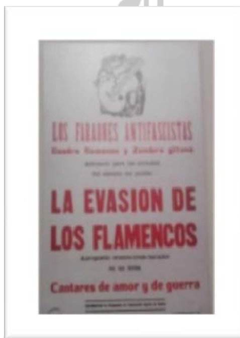
Imagen 2. Exposición de la Valencia Republicana (12 de noviembre de 2016)

No podemos generalizar pero una parte de los artistas flamencos estuvieron a favor de la República y combatiendo el fascismo, así tenemos que interpretar este cartel de los Faraones Antifascistas, con el cuadro flamenco y la zambra gitana, actuando para los soldados republicanos (imagen 2).