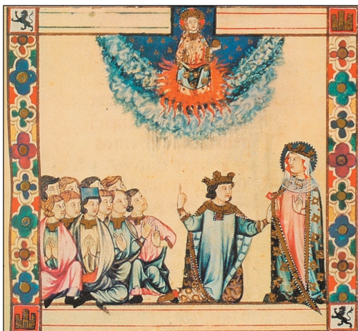
CSM LXX (T.I.1, fol. 104r viñeta 3)