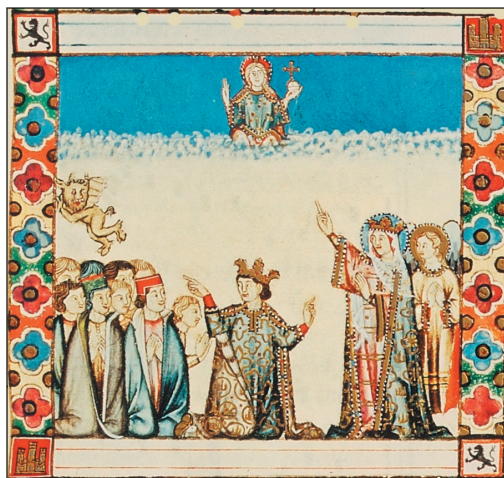
CSM L (T.I.1, fol.74v viñeta 6)

Sobre el salto narrativo: Noli me tangere (CSM L) y la virgen mancada (LXX)