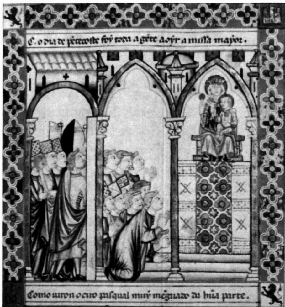
MISA ANTE EL ALTAR DE LA VIRGEN EN LA FIESTA MAYOR DE ELCHE (Recuadro primero de la Cantiga 97 del Códice de Florencia)