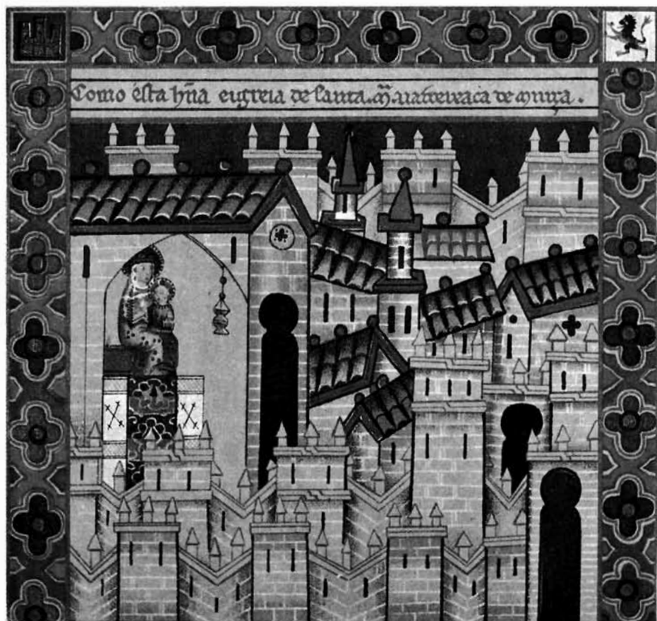
VIRGEN DE LA ARRIXACA Y RECINTO AMURALLADO (Recuadro primero de la Cantiga CLXIX de El Escorial)