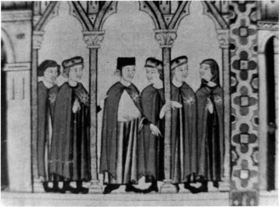
CABALLEROS DE LA ORDEN DE LA ESTRELLA (Recuadros tercero y quinto de la Cantiga 78 del Códice de Florencia)