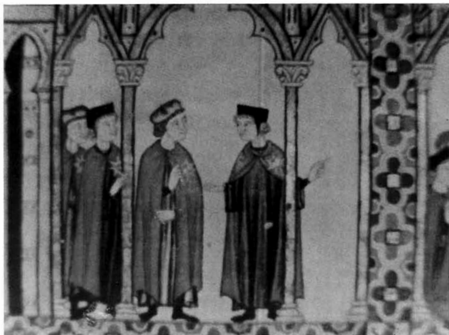
CABALLEROS DE LA ORDEN DE LA ESTRELLA (Recuadros tercero y quinto de la Cantiga 78 del Códice de Florencia)