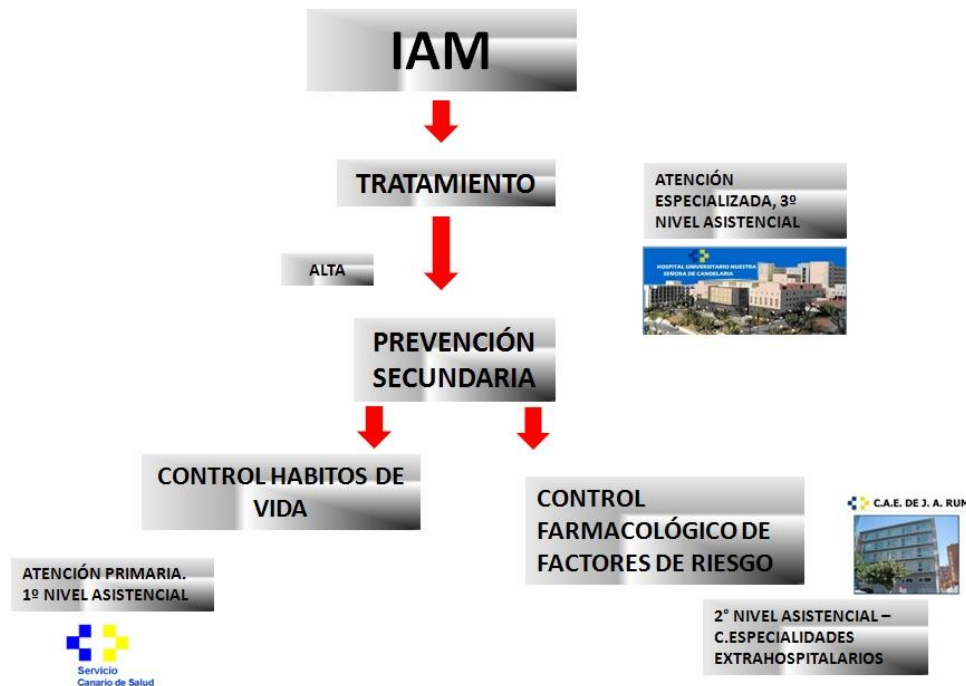
Figura 2: Niveles de atención del SCA

Todo el mundo conoce los beneficios de seguir esta pautas antes descritas, pero la realidad en la unidad coronaria objeto del presente estudio, es que se ha detectado en muchos pacientes que reingresan de nuevo infartados, que han mantenido los mismos hábitos de vida nocivos y no han sabido/querido controlar satisfactoriamente sus factores de riesgo coronarios (reingresan en las mismas condiciones que la primera vez). Siendo evidente el fracaso de la prevención secundaria, la motivación para realizar este estudio persigue los siguientes objetivos: