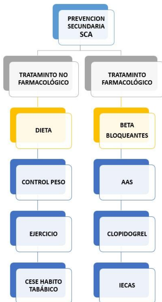
Figura 1: Estrategias actuales de la prevención secundaria del SCA

Según la Sociedad Española de Cardiología, los programas de formación al paciente cardiovascular son imprescindibles para un óptimo pronóstico, ya que es una enfermedad que requiere de la participación del paciente para lograr cambiar sus hábitos de vida y su colaboración en la constancia del tratamiento (10) . En este contexto Enfermería se muestra como pieza clave en este nivel de intervención, como agentes educadores y asesores en la modificación de hábitos nocivos, adquisición de nuevos hábitos cardiosaludables y para el control de factores de riesgo con el objetivo de mejorar la calidad de vida y evitar nuevos eventos coronarios.