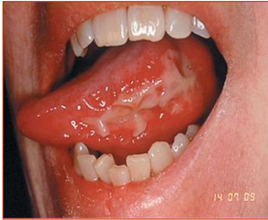
Figura 3. Mucositis en caras laterales