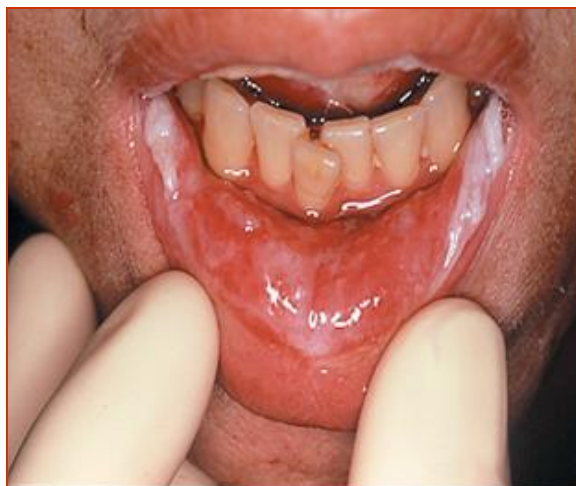
Figura 2. Mucositis en labios

Su localización se da con mayor frecuencia en labios, suelo de boca, mucosa del paladar blando y caras laterales e inferior de la lengua. ( Ver figuras 2, 3, 4 ).