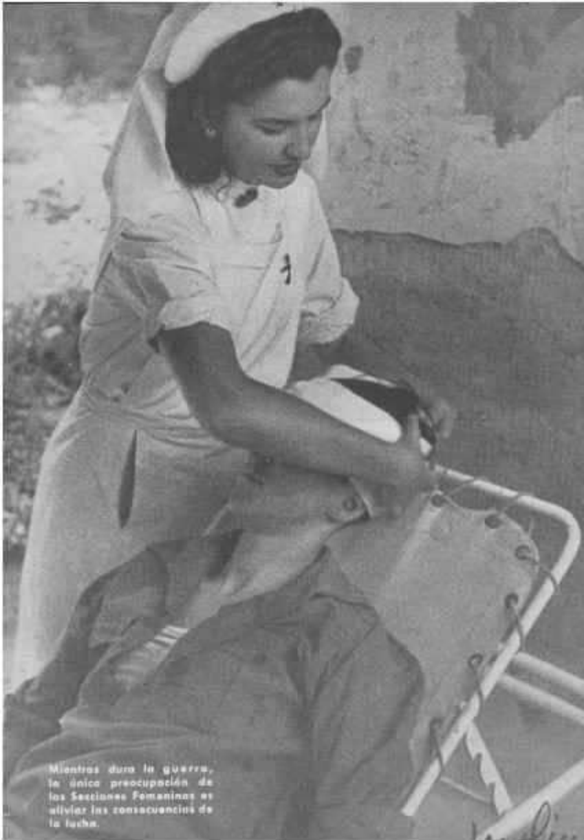
Mientras dura la guerra, la única preocupación de las Secciones Femeninas es aliviar las consecuencias de la lucha.

La formación de las niñas y jóvenes pertenecientes a la Falange competía al Frente de Juventudes pero Pilar Primo de Rivera consiguió el encargo de formar ideológicamente a todas las mujeres, niñas, jóvenes y adultas, estuvieran o no afiliadas a la Falange. Fue una concesión que Franco hizo a la Sección Femenina en 1942. Se organizó a través del Servicio Social para mujeres adultas (que llegó a ser obligatorio para obtener un trabajo) y en los colegios e institutos, a niñas y jóvenes, por parte de las profesoras con asignaturas como Formación del Espíritu Nacional (llamada Política) Hogar, Educación Física, Formación Religiosa y Convivencia Social. Hacer el Servicio Social tenía ciertas ventajas como la preferencia en la atención médica en hospitales y las medicinas gratuitas.