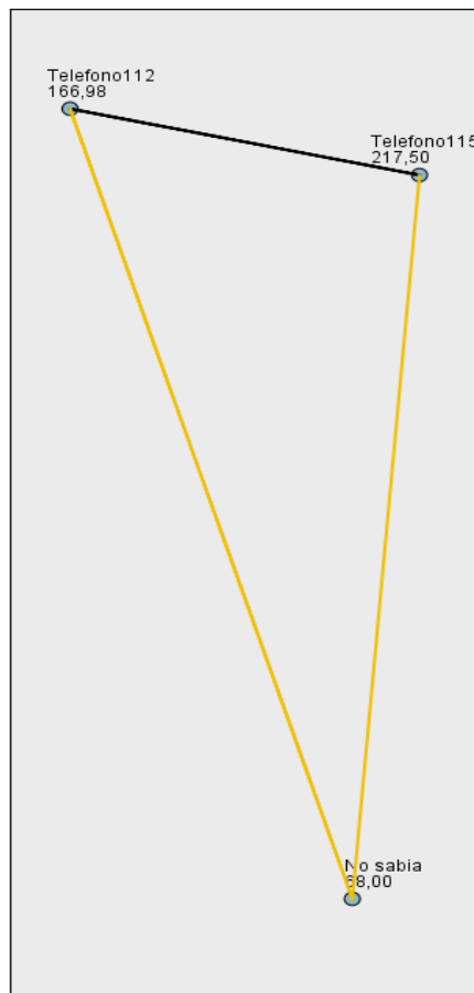
Comparaciones entre parejas de C19Recurso

Cada nodo muestra el rango promedio de muestras de C19Recurso.