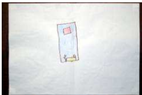
Figura 3 - Desenho do hospital produzido por Vera durante a Avaliação Inicial . Título dado: “Sala”

* Vera (Nome fictício) - Uma criança do sexo feminino, com dez anos e um mês de idade, que cursava a 4ª série primária, com diagnóstico médico de meningite bacteriana aguda. Residia em Goiânia, e tinha como acompanhante seu pai.