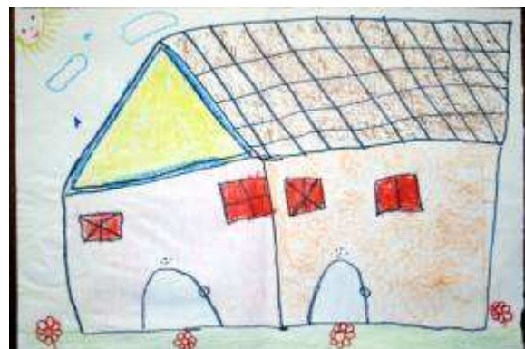
Figura 4 - Desenho do hospital produzido por Vera durante a Avaliação Final . Título dado: “O hospital”