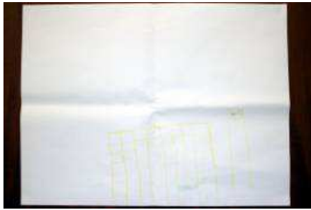
Figura 5 - Desenho do hospital produzido por Délcio durante a Avaliação Inicial . Título dado: "Hospital"