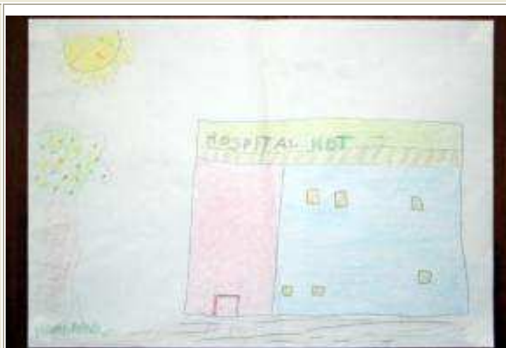
Figura 2 – Desenho do hospital produzido por Alberto durante a Avaliação Final . Título dado: “O hospital HDT”