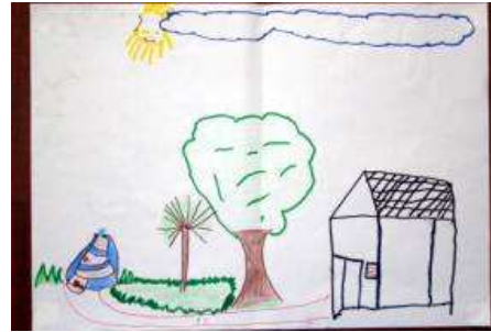
Figura 6 - Desenho do hospital produzido por Délcio durante a Avaliação Final . Título dado: "O hospital"