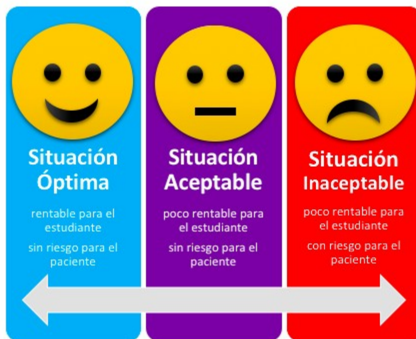
Figura 3. Propuesta de Esquema de Situaciones Clínicas en las que permitir la ejecución por parte del alumno. Elaboración propia.

Puede haber situaciones intermedias en las que realizar el procedimiento no sea imprescindible para su formación, pero que no ponen en riesgo el pronóstico del paciente, con lo que sí se puede permitir que el estudiante realice, siempre bajo supervisión, dicho procedimiento. Un ejemplo de esta situación sería una ecografía obstétrica de tercer trimestre.