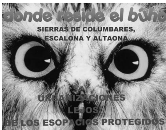
Adhesivos de la campaña informativa

Esta actividad ha tenido una magnífica acogida entre los centros educativos que cumplen así la necesidad de contextualizar los problemas ambientales de las poblaciones.