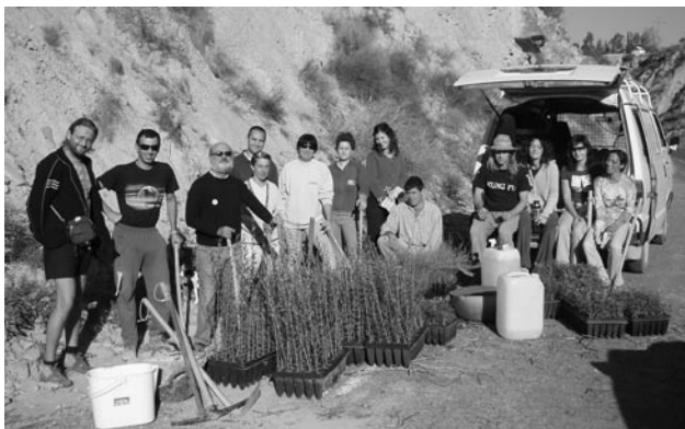
Miembros de ADESGA en actividad de reforestación

En el 2003 nace ADESGA (Asociación Vecinal por el desarrollo sostenible del Garruchal) con el propósito de aunar esfuerzos de los residentes debido a la creciente preocupación por la continua transformación y agresiones hacia el entorno.