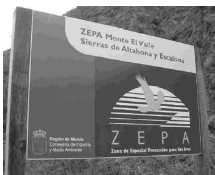
Señalética de los límites de ZEPA