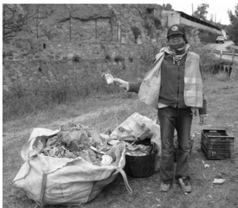
Limpieza de la Rambla, 2005