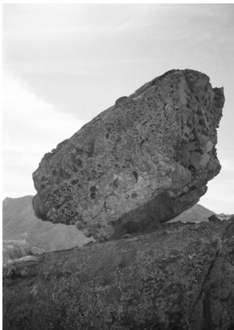
Uno de las fotos premiadas en el I Fotomaratón