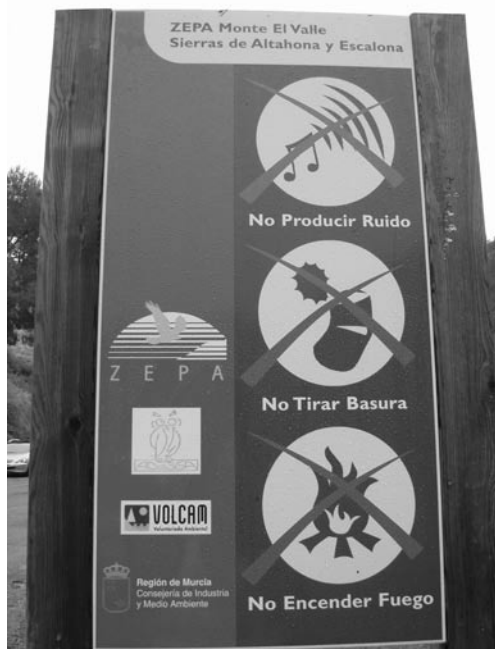
Cartel promotor de comportamiento respetuoso