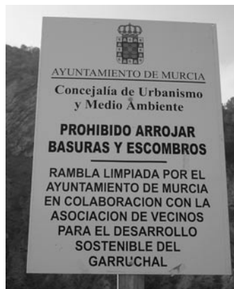
Señalética de limpieza efectuada