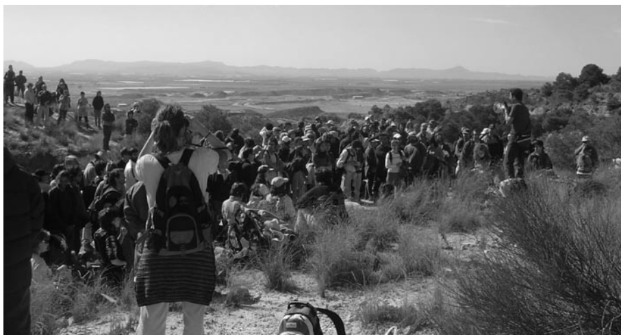
Salida divulgativa sobre las amenazas del territorio