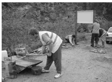
Miembros de ADESGA en tarea de instalación de señalética