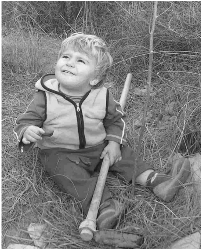
Un joven miembro de ADESGA en tarea de reforestación

Gracias por haber permitido la expresión y difusión de nuestra iniciativa desde esta publicación.