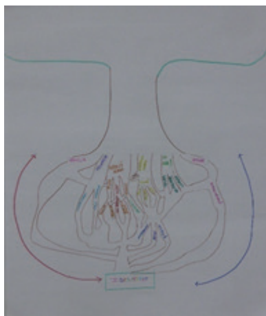
Imagen 6. Cartografía de Sara. Fotografía independiente.