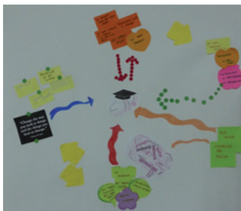
Imagen 7. Cartografía de Teresa. Fotografía independiente.