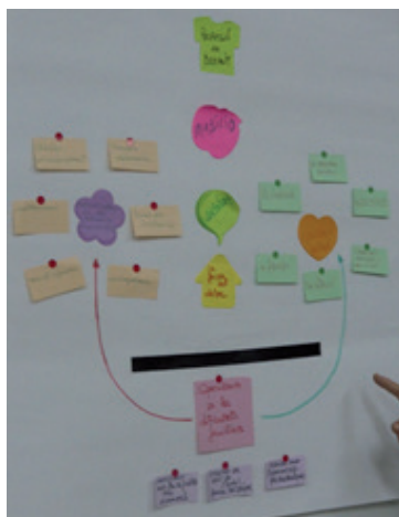
Imagen 3. Cartografía de Alba. Fotografía independiente.