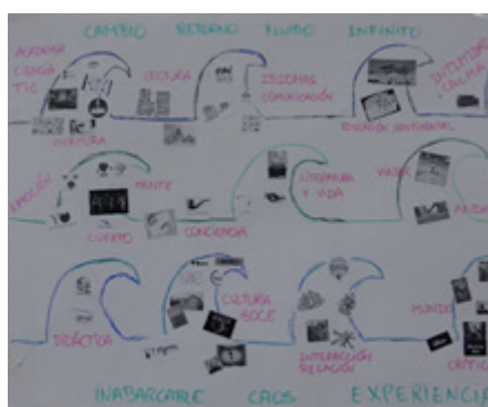
Imagen 4. Cartografía de Montserrat. Fotografía independiente.