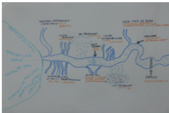
Imagen 5. Cartografía de Manel. Fotografía independiente.