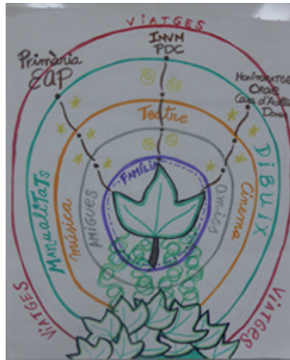
Imagen 2. Cartografía de Sonia. Fotografía independiente.