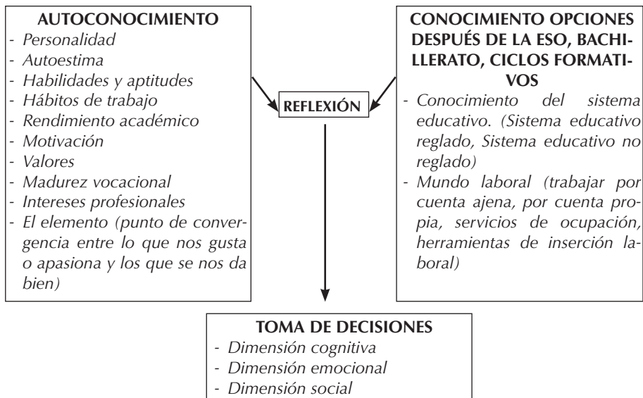
Figura 1. Áreas de intervención de la orientación académica y profesional.

Una de las finalidades de educación secundaria debe ser la de preparar al alumnado para la incorporación a la vida activa, y para la adaptación de manera rápida y eficaz a los cambios sociales y profesionales. Por este motivo, es imprescindible ofrecer una adecuada orientación académica y profesional en esta etapa educativa (LOE, 2006; LOMCE, 2013; Orden ECD/1361/2015). Una etapa fundamental en la madurez y formación del alumnado, sobre todo en los momentos clave (4º de ESO y 2º Bachillerato), donde el alumnado debe afrontar un proceso de toma de decisiones de gran trascendencia, en el que ha de elegir la trayectoria educativa más adecuada y, a su vez, dotarlo de las herramientas y competencias necesarias para garantizar su incorporación efectiva a la sociedad, al mundo laboral. La orientación académica y profesional debe ayudar al alumnado a conocerse a sí mismo, a buscar opciones para después de la ESO, bachillerato y/o ciclos formativos, a decidir y configurar su itinerario académico y profesional (Martín y Tirado, 1997; Álvarez González et al. 1991; Álvarez González y Rodríguez Moreno, 2006; Álvarez González, 2008; Sánchez, 2013). La Figura 1 resume estas tres áreas de trabajo: