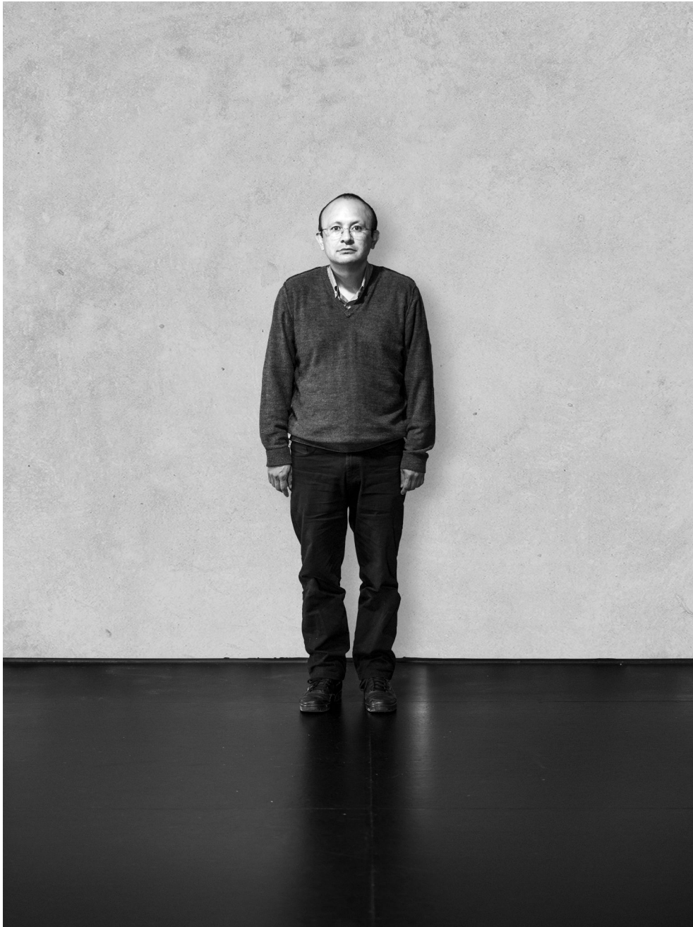
Figura 4. Parra Para Solo.

Con el espacio terminamos la revisión de cada uno de los conceptos. En este último aparte, de la mano de la filosofía, la sociología y también la ciencia, hemos recorrido tres experiencias espaciales que nos permiten comprender el espacio como acción y no tanto como algo preexistente o dado.