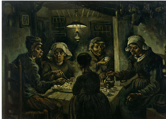
Van Gogh, V. (1885) Los comedores de patatas . [Óleo sobre lienzo] Museo Van Gogh, Amsterdam.

Volvamos al genial Van Gogh, respiremos profundamente, regresemos a la unión con la naturaleza, a la tierra y al campesino. Dice a propósito de los campesinos pintados por su admirado J.F. Millet: «¡Su campesino parece pintado con la tierra que siembra!». ( Ibidem. 157) Otro gran ejemplo es el cuadro de Los comedores de patatas de Van Gogh: