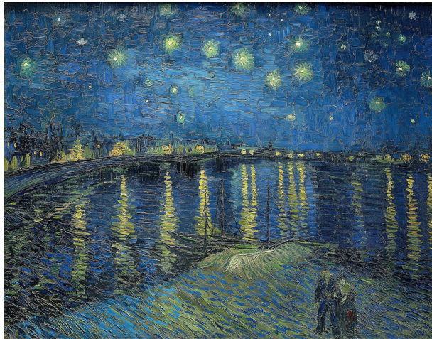
Van Gogh, V. (1888) La Nuit étoilée . [Óleo sobre lienzo] Museo de Orsay, París.

sino que abren el espacio-tiempo, comportan profundidad. Aquí no existe un solo horizonte. Multitudes de luces (plurivocidad) compartiendo cielo, al contrario que en el Sistema PB-AN, donde el cielo-luz (pared blanca) evita otras luces, otros modos de ser, al establecer lugares específicos para que los individuos (agujeros negros) ni luzcan por sí mismos ni permitan otros modos de luz. El Sistema PB-AN es un Sistema clasificador impositivo en el que los espacios son puntos en el mapa. Cómo no traer aquí a Van Gogh, tanto algunos de sus cuadros como citas estelares extraídas de las cartas que le escribió a su hermano Theo.