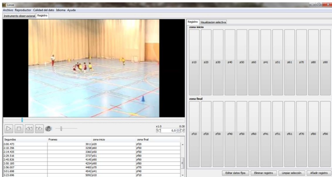
Figura 2. Captura del instrumento de observación en el seno del programa de registro y codificación Lince.