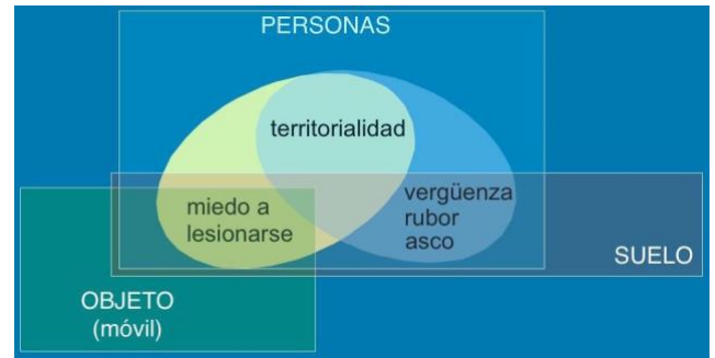
Figura 2. Relación entre las distintas dimensiones de PADC y las fuentes originadoras de los contactos

a una acción motriz que implica entrar en contacto con otros individuos, objetos y/o suelo, y que, además, interfiere en la fase de toma de decisiones, pudiendo dar como resultado una conducta motriz desajustada.