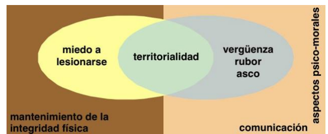
Figura 1. Dimensiones del objeto de estudio

Desde nuestra óptica, la dificultad de definición del objeto de estudio es fruto de la naturaleza pluridimensional del problema (Figura 1) que, a su vez, determina las dimensiones del mismo. Esto nos lleva a tener en cuenta, por un lado, los aspectos relacionados con el mantenimiento de la integridad física, que podríamos asociar con el miedo a lesionarse ; y, por otro, los aspectos asociados a la comunicación y a ciertos aspectos psico-morales que pudieran existir en función de la cultura en la que esté inserto el sujeto, como la vergüenza , el rubor o el asco . Además, entre ambos, consideramos que existe otra dimensión de orden filogenético relacionada con el concepto de territorialidad (Hall, 1989). Todo ello enmarcaría las llamadas esferas o espacios personales . Este concepto, definido por Hall (2003) a mediados del siglo pasado, se corresponde con el uso social que hacemos del espacio y ha sido ampliamente aceptado y/o adaptado por otros autores (Bernard, 1985; Davis, 1987; Descamps 1990; Fast, 1994; Hernández Moreno, 1994; Montagu y Matson, 1989; Pease y Pease, 2006; Sommer, 1974).