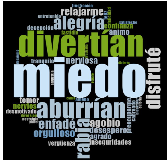
Figura 5. Nube de palabras con mayor frecuencia de aparición.

Los resultados anteriores muestran ya de por sí la importancia que los participantes otorgaron a la vivencia del miedo, mayor aún al realizar el agrupamiento por emociones (Tabla 2). Ahora bien, en este caso, el agrupamiento de palabras entorno a la emoción alegría fue muy superior. De cualquier forma, aunque estas representaciones resultan muy claras, debemos ser cautos en su interpretación, puesto que ciertos términos podrían estar claramente falseados. Es el caso, por ejemplo, de los términos relacionados con la vergüenza, referidos normalmente de forma indirecta mediante expresiones del tipo me da palo, me da cosa, me da reparo, ... y que, por tanto, no son cuantificadas automáticamente por el programa. Además, hay que tener en cuenta que este tipo de representación tampoco recoge las negaciones de los términos (no se divertían, no disfruté, no me enfadé, no tuve miedo...). Es preciso pues acceder al conjunto de textos codificados para extraer una idea completa de la realidad.