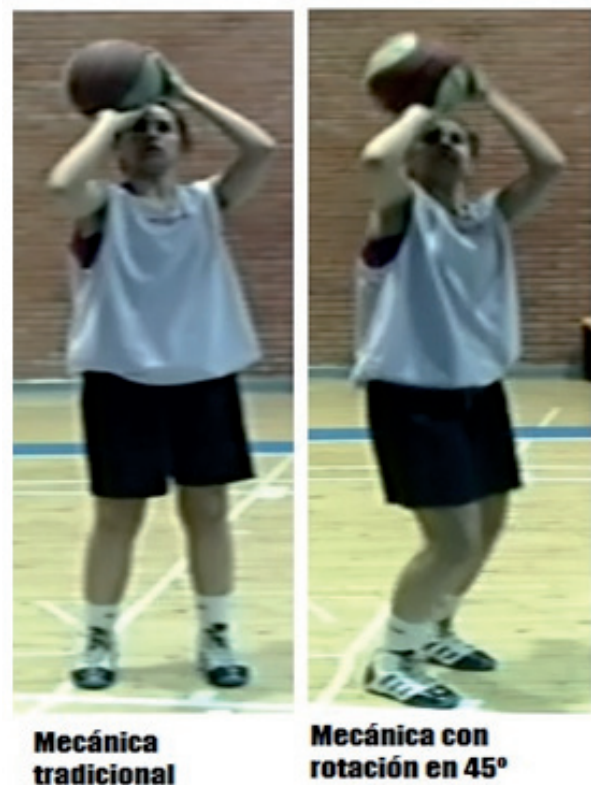
Figura 1. Ejemplo de posiciones de partida en ambas mecánicas.

Por tanto, el objetivo principal del presente estudio es determinar si la aplicación de una mecánica de tiro alternativa, basada en el principio de lateralidades múltiples, podría incrementar significativamente el porcentaje de acierto en los lanzamientos a canasta de corta y media distancia frente a la aplicación exclusiva de una única mecánica de tiro tradicional en jugadores homogéneos.