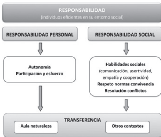
Figura 1. Dimensiones del valor de la responsabilidad y su relación con las capacidades y habilidades a desarrollar en el programa.