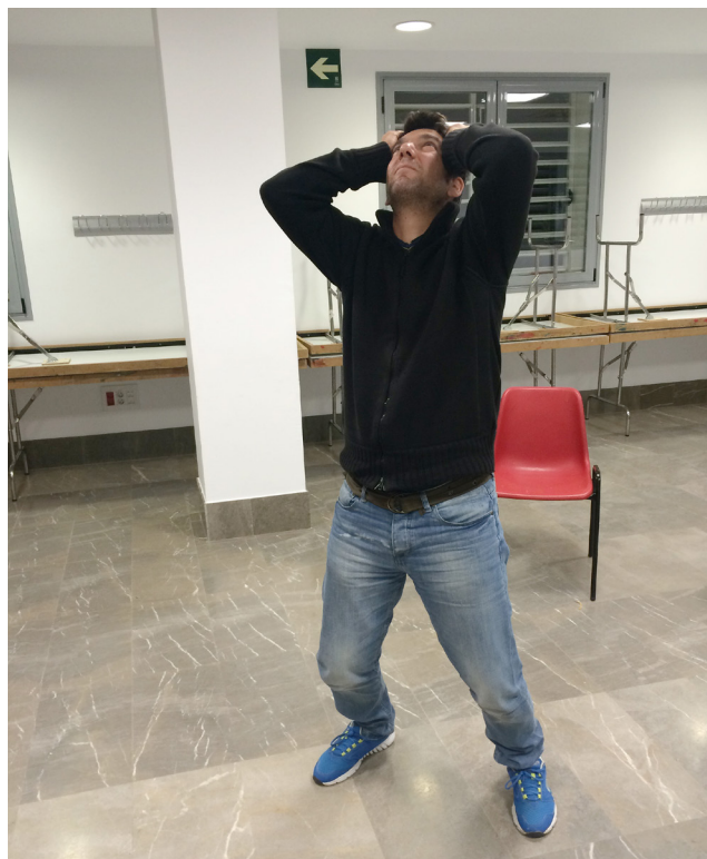
IMAGEN 1. "DESESPERACIÓN". TALLER DE TEATRO EN CENTRO DE ACOGIDA DE SEVILLA