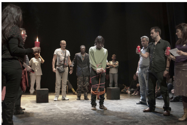
IMAGEN 3. ACTUACIÓN EN SALA TNT. SEVILLA

con el público asistente a una representación. La obra estuvo basada en las experiencias de opresión y sometimiento que los actores habían sentido en sus vidas como personas sin hogar. La escena representaba un proceso donde el actor que está en el centro está atado por causas externas (estigmas producidos por la sociedad) e internas (pérdida de la identidad y auto-culpabilización). Sin embargo, como corolario de la escena, en un acto simbólico se pidió al público que ayudase a romper las cuerdas de la víctima. Mientras, otro actor recitaba la declaración de los derechos humanos, en una adaptación que hizo el grupo y en la que se pidió (alegóricamente) la participación de toda la sociedad en la materialización de los mismos. Una vez finalizada la representación, el grupo de actores invitaron a los espectadores a sentarse con ellos y ellas en el escenario con objeto de abrir un espacio de diálogo, un foro de discusión acerca de los contenidos tratados en la obra, así como otros aspectos relacionados con la estética, la metodología del montaje, etc. En estos foros se producen intercambios donde el público (parte de la sociedad) puede desvelar esa otra verdad, contada a través de la fábula dramática. De algún modo, los debates constituyen medios de ejemplificar unas cotidianidades desconocidas para la mayoría de la sociedad.