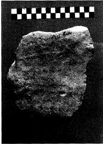
Uno de los «ostraca» de Serrin.