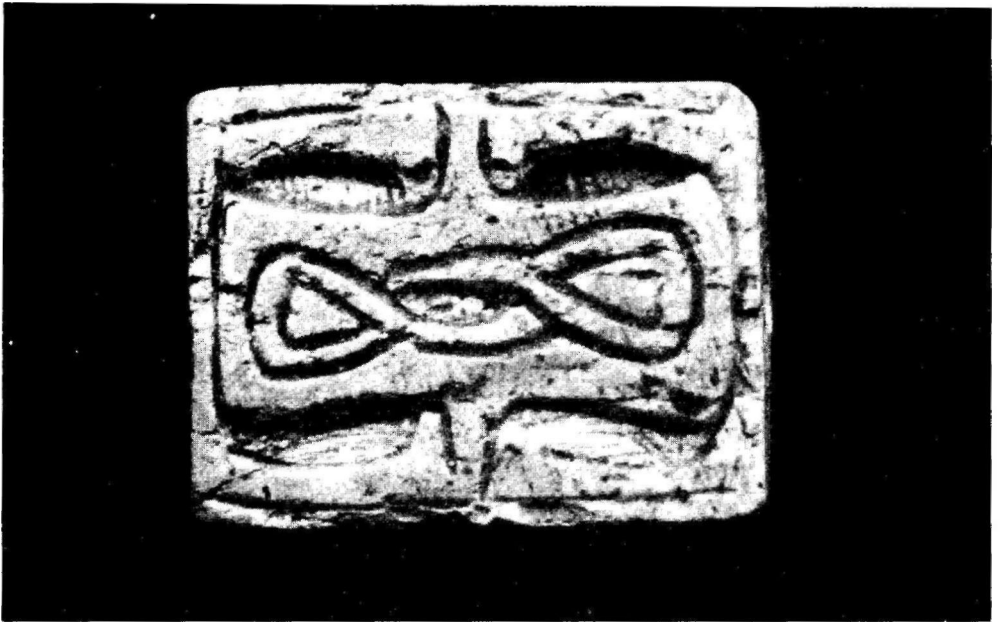
LÁMINA 2. Reverso del colgante tardorromano.