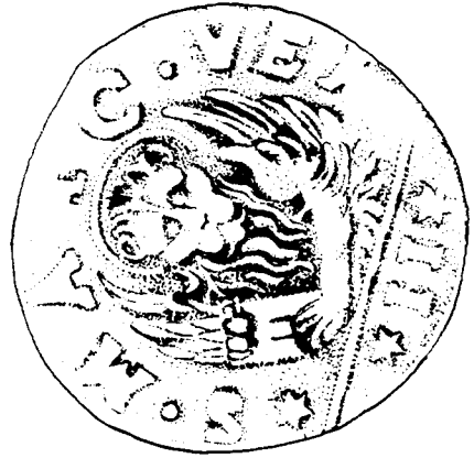
FIGURA 1. "Medalla" de S. Marcos (dibujo M. o José Rubio Martínez).