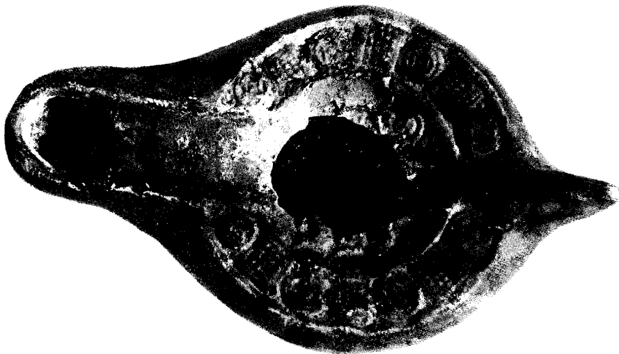
LÁMINA I. (fotografía Raimundo Ruano Ríos).

Pieza casi completa a la que falta el centro del disco y parte de la base. Fracturada y pegada tras su hallazgo. Estado de conservación bueno.