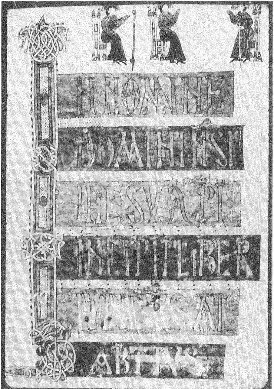
15.- Los legisladores visigodos. Ilustración del Liber Indicum. Códice Emilianense.