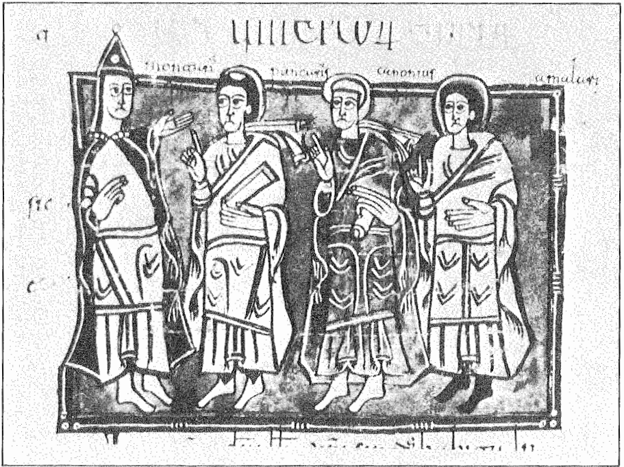
10.— Amalario. Concilio II de Toledo. Códice Vigilano. Fol. 143 v.