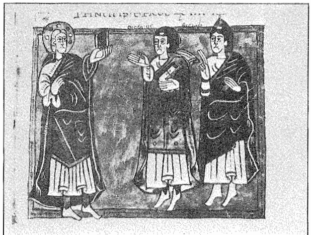
7.- Recesvinto en el X Concilio de Toledo. Códice Vigilano. Fol. 183.