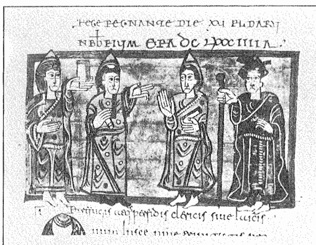
4.- Khindasvinto en el VII Concilio de Toledo. Código Vigilano. Fol. 167.