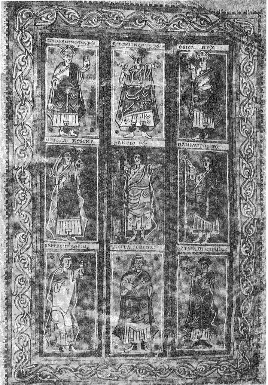
13.- Retratos de los reyes Chindasvinto, Recesvinto y Egica (arriba). De los monarcas de Pamplona y de Viguera (medio) y de los autores del código. Códice Vigilano.