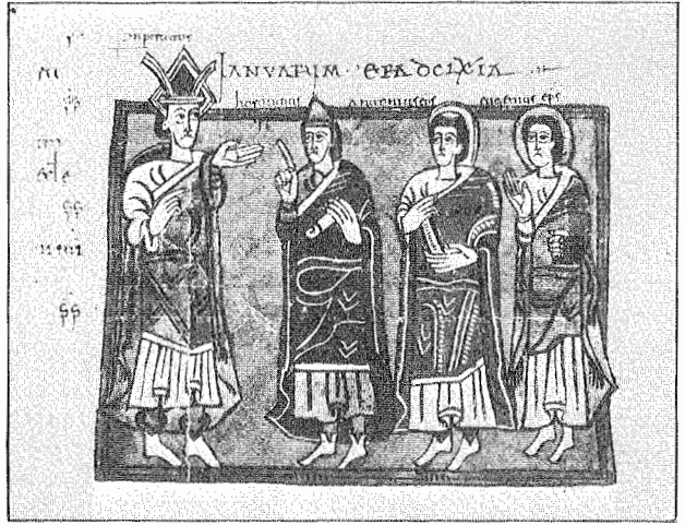
5.- Recesvinto en el VIII Concilio de Toledo. Códice Vigilano. Fol. 169 v.