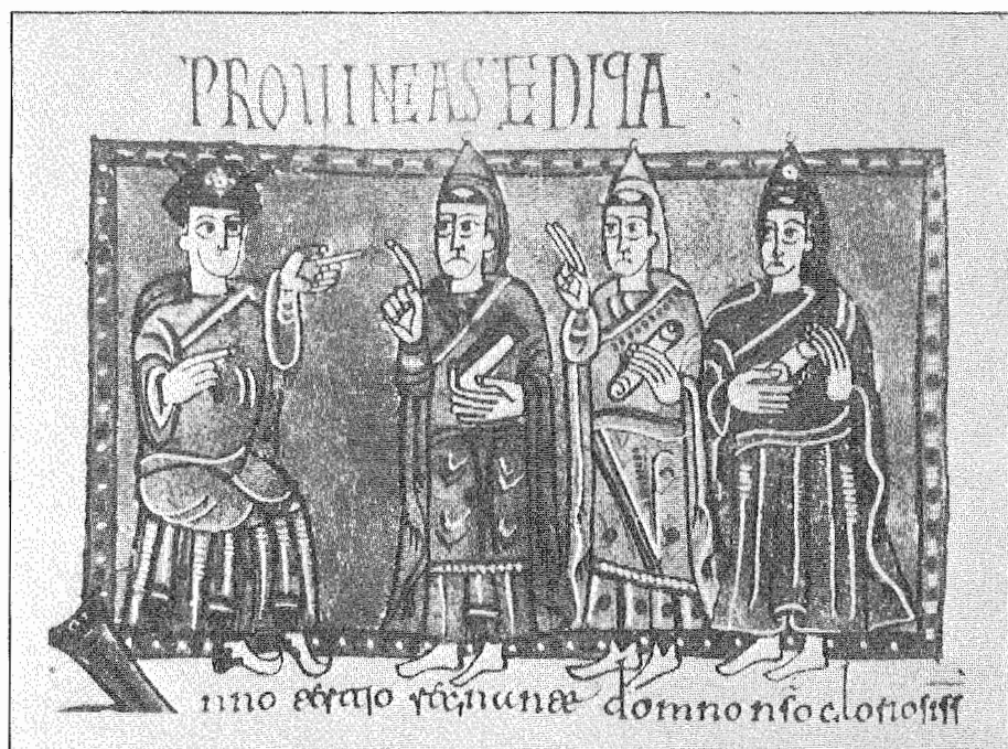
2.- Sisenando en el IV Concilio de Toledo. Códice Vigilano. Fol. 151 v.