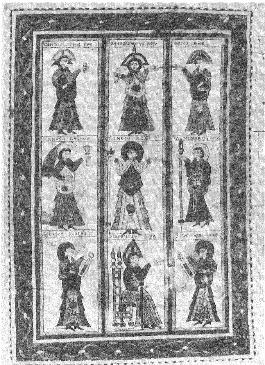
14.- Retratos de los reyes Chindasvinto, Recesvinto y Egica (arriba). De los monarcas de Pamplona y de Viguera (medio) y de los autores del código. Códice emilianense.