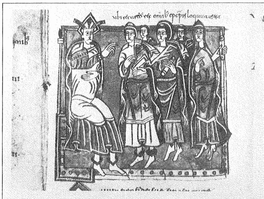
1.- Recaredo en el III Concilio de Toledo. Códice Vigilano. Fol. 145.