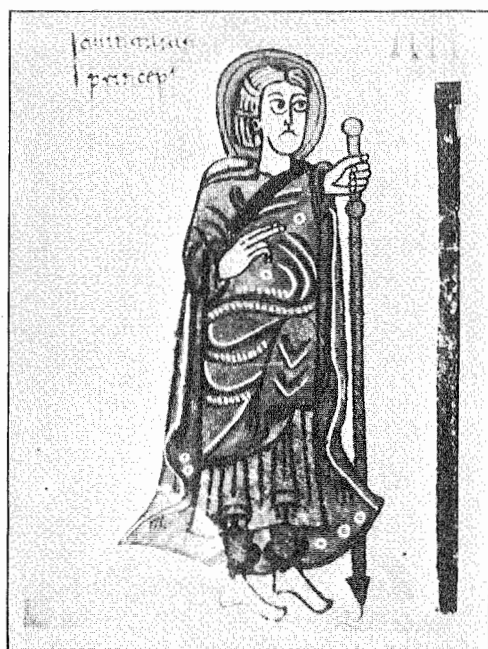
3.- Khintila en el V Concilio de Toledo. Código Vigilano. Fol. 161 v. detalle.