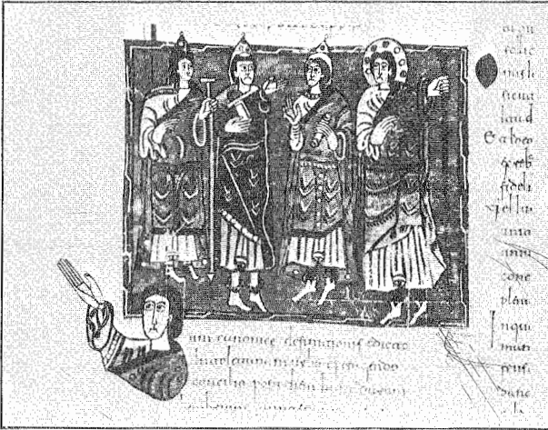
6.- Recesvinto en el IX Concilio de Toledo. Fol. 180 v. Códice Vigilano.